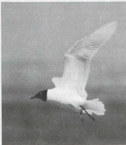
18. Zwartkopmeeuw Larus melanocephalus, De Maasvlakte (ZH), april 1981