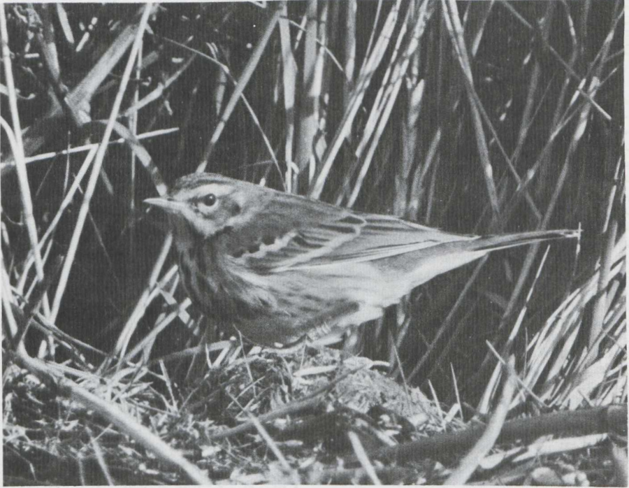
Olive-backed Pipit Anthus hodgsoni , England, October 1981 (Keith Atkin)

7 It likely would not require much study to us to decide that the individual in plate 15 ( Dutch Birding 4: 22, 1982) is one of the Palearctic pipits Anthus . The bill size and shape, the general body shape, and the terrestrial behaviour should eliminate all but pipits. Careful plumage analysis though is necessary to determine which species this is. On this still photograph the plumage characters are neatly delineated, a position we are less than always in when observing pipits. Yet even with an active or skulking individual, several conspicuous field marks are available to us given enough patience.