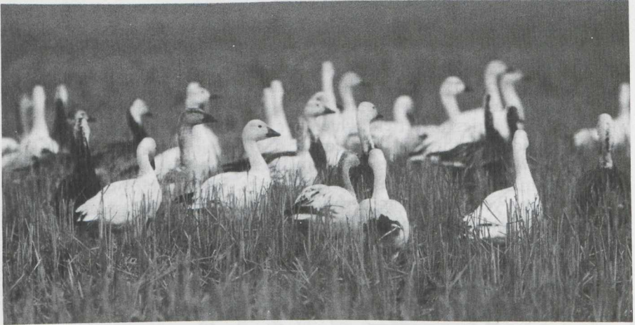
21. Lesser Snow Geese Anser c. caerulescens , Texas, February 1982

The Lesser Snow Goose observed in the Netherlands was ringed as gosling at LPB in 1977. It is of interest that the sighting involved a male. An analysis of hunter recoveries of both male and female Lesser Snow Geese reported in North America is presented in figure 2 and 3. Although the pattern for both is generally similar, and recoveries of either sex outside the flyways are extremely rare, there are isolated male recoveries that are of interest. These include several recoveries of males in northern Québec (figure 3), and most recently a male blue phase bird was found at the Brigantine National Wildlife Refuge (New Jersey). A partial explanation of this phenomenon involves the return of a female, upon mating, to her natal colony. The choice of a mate is made on the southern wintering grounds or during spring migration when birds from many arctic colonies mix. Thus, a LPB male, if paired with a female from an eastern arctic colony, will probably never return to LPB but will follow his mate to the colony at which she hatched.