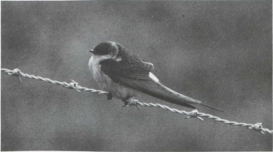
25. Roodstuitzwaluw Hirundo daurica , Lopik (U), april 1982 (Edward J. van IJzendoorn)

De ondervleugeldekveren hadden de zelfde kleur als de buik. De poten waren niet bevederd - hetgeen bij een Huiszwaluw wel het geval is. De vlucht leek wat minder beweeglijk dan die van een Boerenzwaluw. Geluid werd niet gehoord.