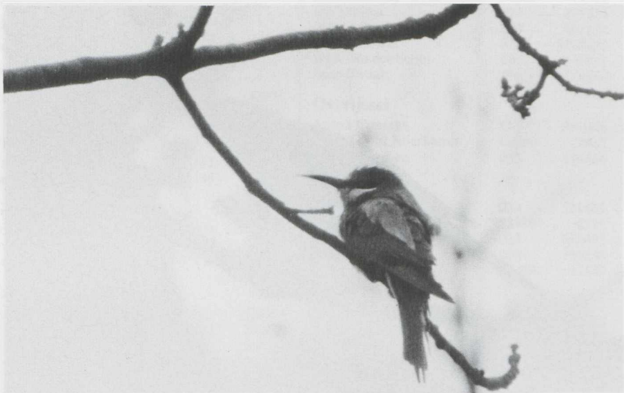
32. Bijeneter Merops apiaster , Texel (NH), mei 1982

onvolwassen Grote Burgemeester L. hyperboreus te IJmuiden (NH). Lachsterns Gelochelidon nilotica werden gemeld in de Harderbroek op 24 mei, te Uffelte (D) op 31 mei, op de Dwingelose Heide (D) op 3 juni en te Burgervlotbrug (NH) op 10 juni (Twee). Het was het zevende jaar in successie dat een Dougalls Stern Sterna dougallii , gepaard met een Visdief S. hirundo , broedde in Het Zwin. Witwangsterns Chlidonias hybridus werden waargenomen langs de Knardijk (Fl) op 26 mei (drie), op de Strabrechtse Heide (NB) in de eerste week van juni en te Aarlanderveen (ZH) op 24 juni. Eveneens op de Strabrechtse Heide was half mei een Witvleugelstern C. leucop-terus aanwezig.