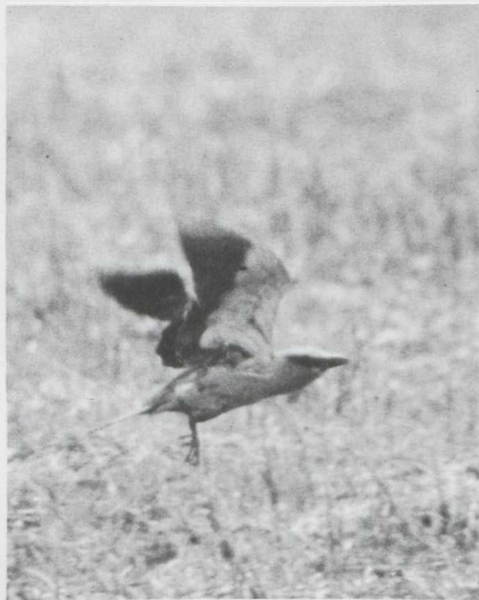
33. Scharrelaar Coracias garrulus , Zuidelijk Flevoland, mei 1982 (Edward van IJzendoorn)

Alpengierzwaluwen Apus melba werden waargenomen op 16 mei te Wassenaar (ZH) en op 21 mei te Boechout (A). Bijeneters Merops apiaster verbleven op Texel van 7 tot en met 9 mei en te Havelte (D) op 27 mei. De eerste Scharrelaar Coracias garrulus verscheen te Heiloo (NH) op 9 mei. Twee exemplaren lieten zich uitvoerig waarnemen in Zuidelijk Flevoland van 21 tot en met 26 mei; andere werden gezien in Oostelijk Flevoland, de AW-duinen