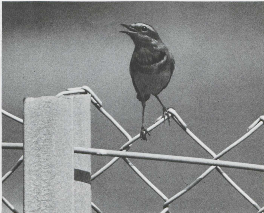
31. Roodgesterde Blauwborst Luscinia s. svecica , mannetje, De Maasvlakte (ZH), mei 1982 (Arnoud B. van den Berg)

himantopus op. Exemplaren werden gezien te Castricum (twee), Lauwersoog (Gr) en Ossendrecht (NB) (drie). De twee vogels die werden waargenomen in de Oostvaardersplassen, de Harderbroek (Fl) en het Harderbos waren mogelijk steeds dezelfde. De gehele maand mei was een groep Morinelplevieren Charadrius morinellus te zien op de vlasakkers langs de Ossenkampweg in Zuidelijk Flevoland; halverwege de maand werden er 34 geteld. In de zelfde maand werden Morinellen waargenomen te Castricum, op De Maasvlakte (ZH) (twee) en in Oostelijk Flevoland (vijf). Opmerkelijk was de vondst van een nest met vier eieren van de Bonte Strandloper Calidris alpina in het Lauwersmeer. Op 15 mei werd op De Maasvlakte, temidden van een groep Bontbekplevieren C. hiaticula , een Breedbekstrandloper Limicola falcinellus gezien. Interessant was de mogelijke Steltstrandloper Micropalama himantopus op 12