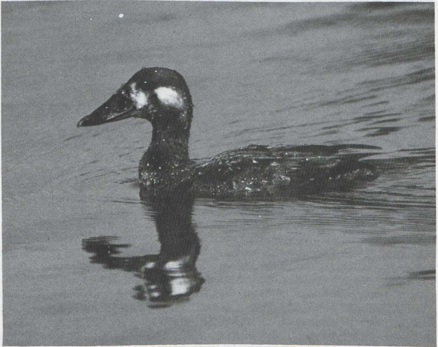
24. Mystery photograph 8. Solution in next issue

Thede G. Tobish, 513½ East 24th Street, 5, Anchorage, Alaska 99503, USA Jon L. Dunn, 4710 Dexter Drive, Apartment 7, Santa Barbara, California 93110, USA