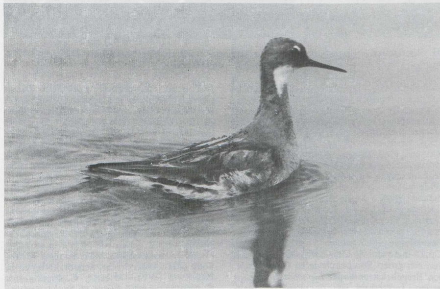
30. Grauwe Franjepoot Phalaropus lobatus , Lauwersmeer (Fr/Gr), juni 1982 (René Pop)