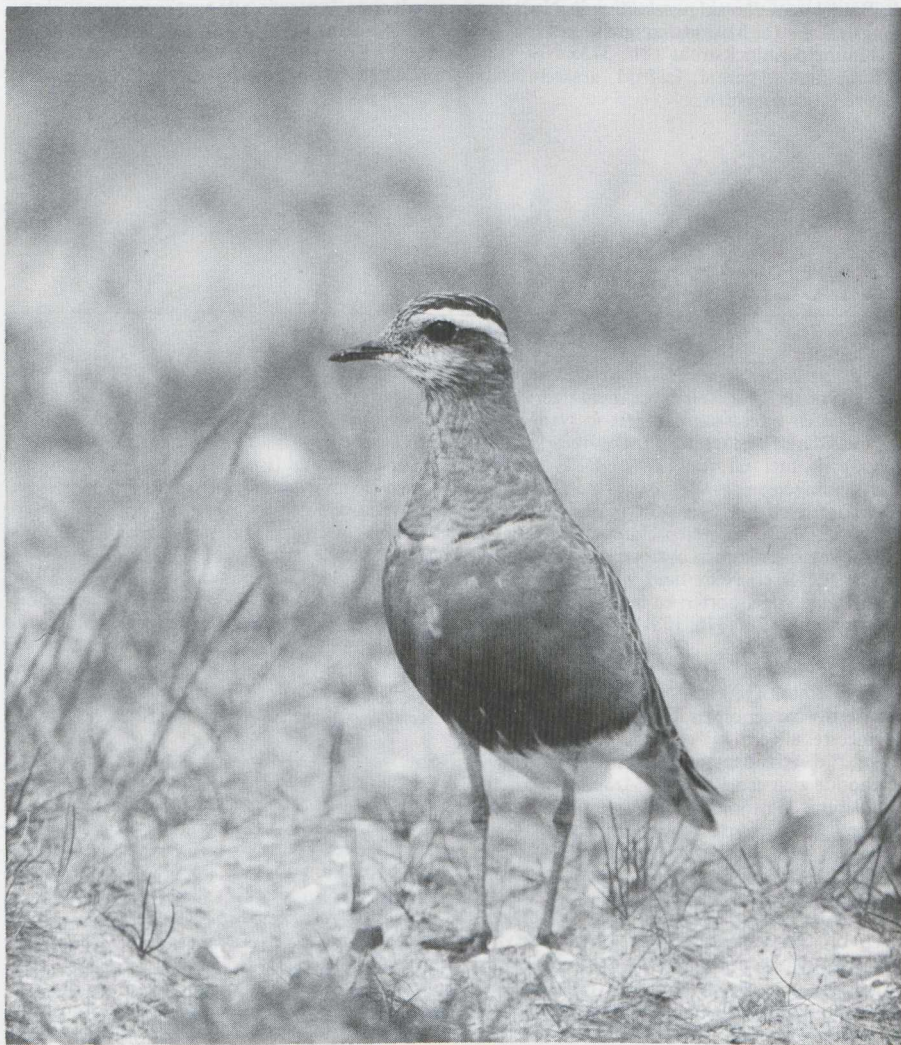
28. Morinelplevier Charadrius morinellus , De Maasvlakte (ZH), mei 1982

Een Kraanvogel Grus grus trok over Beesd (Gld) op 13 mei en één over Castricum (NH) op 15 mei. In het Lauwersmeer (Fr/Gr) verbleven half juni vijf exemplaren waarvan één ook nadien nog werd gezien. Op verschillende plaatsen doken in mei Steltkluten Himantopus