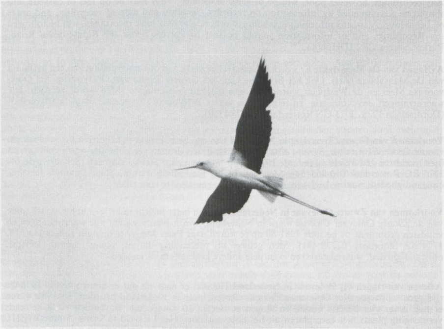
27. Steltkluut Himantopus himantopus , Oostvaardersplassen (Fl), juni 1981 (René Pop)

Voorkomen van Steltkluut in Nederland Om een beter inzicht te krijgen in het voorkomen van de Steltkluut Himantopus himantopus in Nederland, wordt men verzocht alle waarnemingen en (nest)vondsten gedurende de periode 1951-80 op te sturen naar Karel Mauer (Hengelostraat 85, 1324 GV Almere-Stad/03240-33398). Men gelieve bij toezending datum, plaats, aantal, leeftijd, geslacht, omstandigheden, waarnemer(s) en eventuele andere gegevens te vermelden.