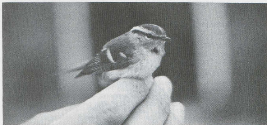
23. Pallas's Warbler Phylloscopus proregulus , Tzummarum (Friesland), October 1980 (Joop Jukema)