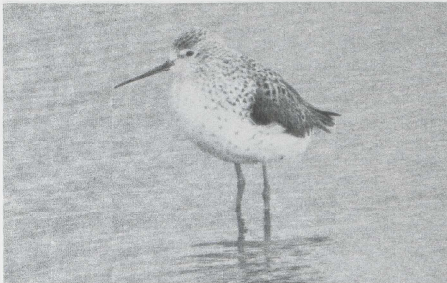
29. Poelruiter Tringa stagnatilis , volwassen in zomerkleed, Hurwenen (Gld), april 1982 (Arnoud B. van den Berg)