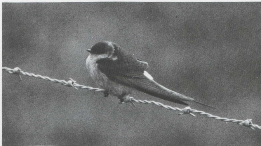
25. Roodstuitzwaluw Hirundo daurica , Lopik (U), april 1982 (Edward J. van IJzendoorn)

De ondervleugeldekveren hadden de zelfde kleur als de buik. De poten waren niet bevederd - hetgeen bij een Huiszwaluw wel het geval is. De vlucht leek wat minder beweeglijk dan die van een Boerenzwaluw. Geluid werd niet gehoord.