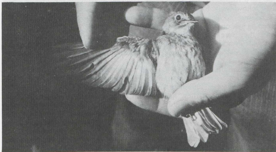
47. Brown Flycatcher Muscicapa latirostris , after first-year, BRD, August 1982

MEASUREMENTS AND WING FORMULA. Wing length (maximum length) 77.5 mm; tail length 47.5 mm; bill length (from forehead feathering) 13.0 mm and bill width (at base) 7.0 mm. First primary 45.9 mm shorter than second; outermost secondary 27.5 mm shorter than tip of wing. Third primary longer than or equal to fourth, fourth longer than second, second longer than fifth, and fifth longer than sixth primary.