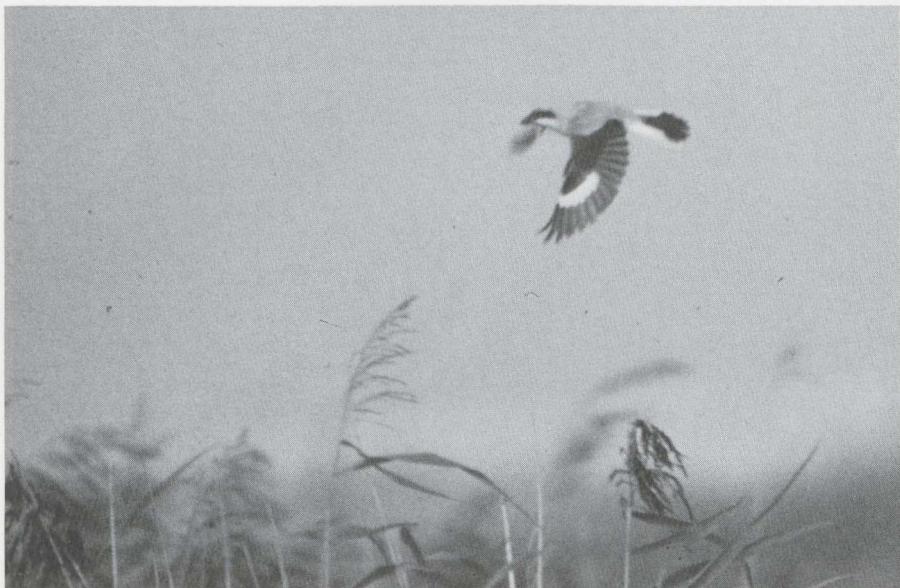
56. Kleine Klapekster Lanius minor , Terschelling (Fr), september 1982 (Eric Bos)

en met 17 juli. Flinke aantallen Grauwe Franjepoten P. lobatus bevonden zich in augustus in het Lauwersmeer (10) en in Zuidelijk Flevoland (zeven). Een juveniele Kleinste Jager Stercorarius longicaudus vloog langs IJmuiden op 22 augustus en een volwassen exemplaar verscheen op Terschelling op 12 september. Bij Oostende werd op 3 september een maximum aantal van 27 Geelpootmeeuwen Larus cachinans geteld. In de loop van de periode steeg het aantal exemplaren op De Maasvlakte tot zes. Verrassend was de ontdekking van twee Geelpoten in Zuidelijk Flevoland in augustus en september. Zoals ieder jaar verschenen in juli en augustus enkele 10-tallen Lachsterns Gelochelidon nilotica op hun slaappleats op het Balgzand (NH). Daarbuiten werden exemplaren gezien te Haren (Gr), Kalmthoutse Heide (A), Steile Bank (Fr), Smilde (D) en Het Zwin. Maximaal 22 Reuzensterns Sterna caspia werden geteld op de traditionele slaappleats op de Steile Bank op 29 augustus. Kleine groepjes werden bovendien vooral gezien in Flevoland. Op 13 juli pleisterde korte tijd een Dougalls Stern S. dougallii op het door badgasten druk bezochte strand van IJmuiden. Op 22 augustus verbleven twee Witwangsterns Chlidonias hybridus te Bloklersdijk. Na de eerste week van