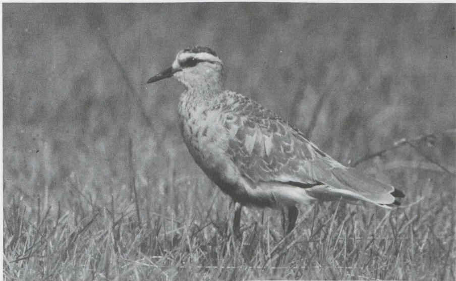
55. Steppekievit Chettusia gregaria , Schiermonnikoog (Fr), augustus 1982

Grote Zilverreiger x Blauwe Reiger geobserveerd. Zwarte Ooievaars Ciconia nigra waren schaars: zij werden gemeld te Kalmthout (A) op 16 augustus, in oostelijk Groningen op 4 september (twee) en in het Lauwersmeer (Fr/Gr) op 5 september.