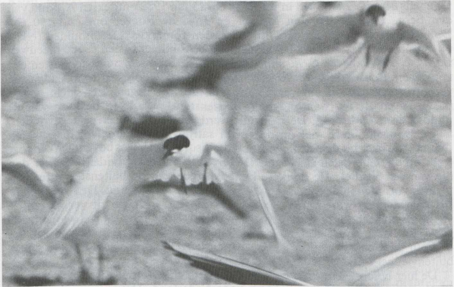
45-46. Dougalls Stern Sterna dougallii , volwassen vogel in zomerkleed, IJmuiden (NH), juli 1982