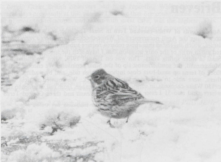
53. Ortolaan Emberiza hortulana , mannetje, Lelystad-Haven (Fl), december 1981 (Jan van Laar)

Misschien dat het systematisch verzamelen van winterwaarnemingen van zomervogels kan leiden tot een beter inzicht in de oorzaken die aan deze late waarnemingen ten grondslag liggen.