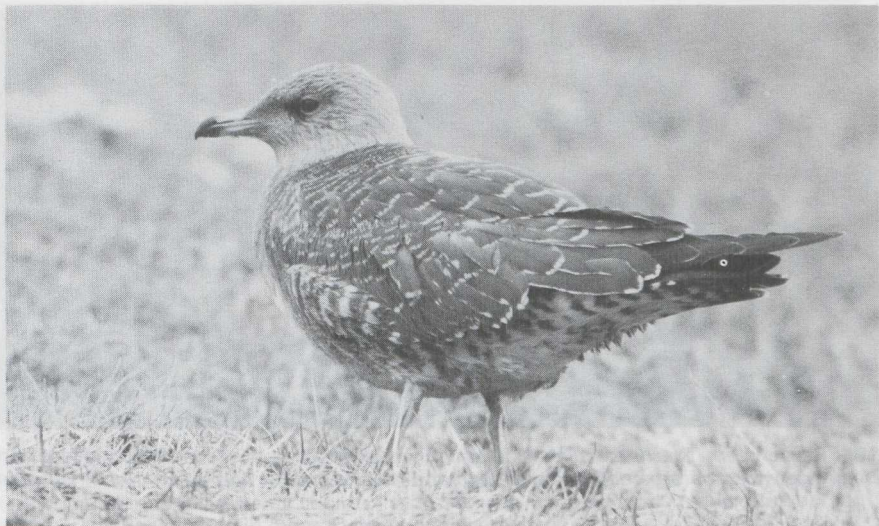
99 Kleinste Jager Stercorarius longicaudus in juveniel kleed, Hondsbosse Zeewering, Noordholland, september 1983. 100 Grote Jager S skua in juveniel kleed, IJmuiden, Noordholland, september 1983.