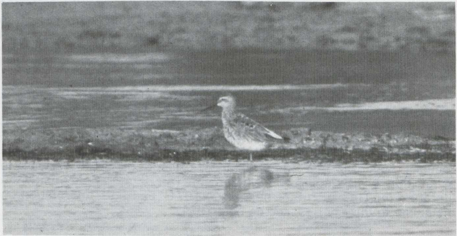
75 Stilt Sandpiper Micropalama himantopus , assuming alternate (= summer) plumage, Mallorca, Spain, may 1983.

SIZE & BUILD Size between that of Curlew Sandpiper and Redshank Tringa totanus , c 15% larger than former. Neck and bill both longer than those of Curlew Sandpiper; bill straight along almost whole length with slight droop at tip, almost same thickness throughout with slightly expanded tip. Legs much longer than those of Curlew Sandpiper, projecting beyond tail in flight.