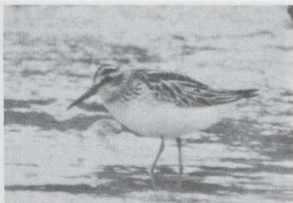
98 Breedbekstrandloper Limicola falcinellus in juveniel kleed, Serooskerke, Zeeland, augustus 1983 (Arnoud B van den Berg).

De waarnemingen van twee verschillende Reuzensterns op Texel op 25 augustus waren het derde en vierde geval voor dit waddeneiland. Maximaal zes Witvleugelsterns Chlidonia leucopterus verbleven in Flevoland. Andere werden waargenomen op het Balgzand in augustus en september (minstens twee), op Marken Nh op 12 augustus (zes), bij Den Oever op 6 en 20 augustus en te Serooskerke in de derde week van augustus.