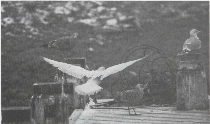
81 Leucistische Zilvermeeuw Larus argentatus in eerste basiskleed (= eerste winterkleed), IJmuiden, Noordholland, februari 1983. 82 Grote Burgemeester L hyperboreus in eerste basiskleed, pikkend naar Zilvermeeuw, IJmuiden, februari 1983.