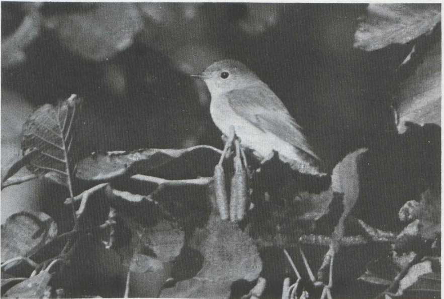
88 Kleine Vliegenvanger Ficedula parva in juveniel kleed, Terschelling, Friesland, oktober 1983.

Vogelen op Terschelling in september en oktober 1983 De twee vogelweken welke door de Stichting Dutch Birding Association van 16 tot en met 23 september en van 7 tot en met 14 oktober 1983 op Terschelling Fr georganiseerd werden, verliepen ook dit jaar weer succesvol. Er werden in totaal niet minder dan 180 vogelsoorten gezien: 154 in september en 147 in oktober. Dit jaar werd het hoogtepunt gevormd door een Noordse Nachtegaal Luscinia luscinia die zich op 23 september een half uur lang bij Oosterend liet zien. Verder werden de volgende zeldzame en interessante vogels waargenomen: c 20 Grauwe Pijlstormvogels Puffinus griseus , enkele Noordse Pijlstormvogels P puffinus , c 30 Vale Stormvogeltjes Oceanodroma leucorhoa , een Kuifaalscholver Phalacrocorax aristotelis , een Visarend Pandion haliaetus , een Morinelplevier Charadrius morinellus , veel Bokjes Lymnocyptes minimus , c 30 Middelste Jagers Stercorarius pomarinus , minstens een Kleinste Jager S longicaudus , c 10 Grote Jagers S skua , minstens vijf Vorkstaartmeeuwen Larus sabini , enkele Grote Piepers Anthus novaeseelandiae , een Sperwergrasmus Sylvia nisoria , drie Bladkoninkjes Phylloscopus inornatus en een Kleine Vliegenvanger Ficedula parva . Bovendien werd op 7 en 8 oktober in de haven van Harlingen Fr een Witwangstern Chlidonias hybridus in eerste basiskleed (= eerste winterkleed) waargenomen.