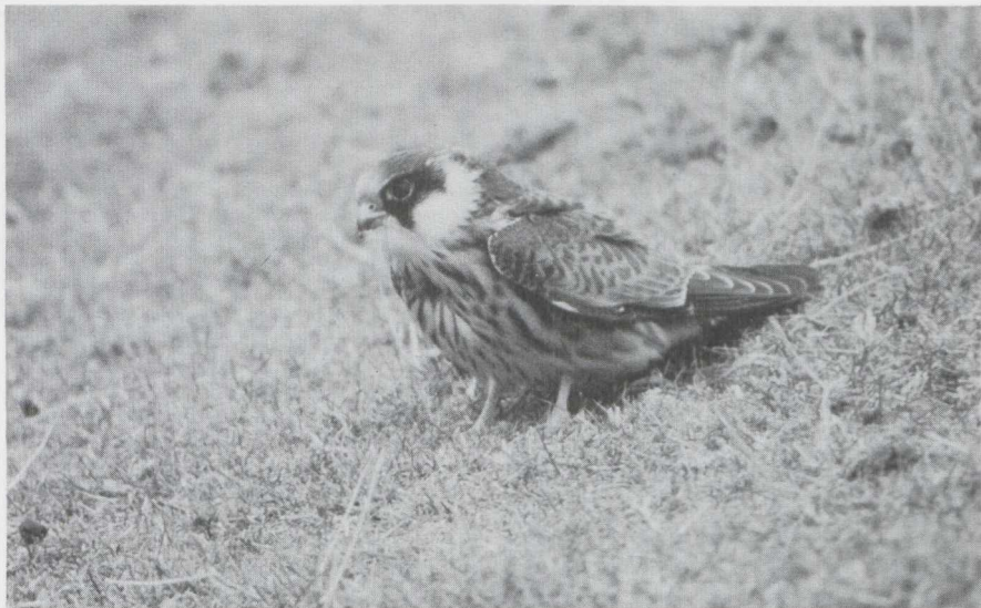
92 Roodpootvalk Falco vespertinus in juveniel kleed, Eemshaven, Groningen, september 1983 (Ronald Groenink).

EENDEN TOT VALKEN Op 20 en 23 augustus zat er een groep van zeven Casarca's Tadorna ferruginea in de Oostvaardersplassen. Ook op andere plaatsen werden exemplaren gezien. Er waren slechts enkele meldingen van de Witoogend Aythya nyroca . Zo zat er op 19 september een paartje op het Alkmaardermeer Nh en op 25 september een mannetje te Vlagtwedde Gr. Op diverse plaatsen werden Zwarte Wouwen Milvus migrans gezien. Er was een niet-geslaagd broedgeval te Bornem A. Er waren ook diverse Rode Wouwen M. milvus . In Twenthe O broedde met succes een paartje. Voor zover bekend het derde geval voor Nederland. Bovendien was er een niet-geslaagd broedgeval te Lippelo A. Op 18 augustus werd op Terschelling een Roodpootvalk Falco vespertinus waargenomen. In september was er een kleine influx. Zo verschenen er Roodpootvalken te Almere Fl, Deinum-Marssum Fr, Eemshaven Gr (drie), Goes Z, Lauwersmeer, Maarssen U, Metslawier Fr, Den Oever Nh, Vlaardingen Zh en Het Zwin Wvl. Bijzonder vroeg was de waarneming van een mannetje Smelleken F. columbarius op 27 juli in de Harderbroek Fl. Op 24 juli werd de eerste Slechtvalk F. peregrinus gezien in Zuidelijk Flevoland.