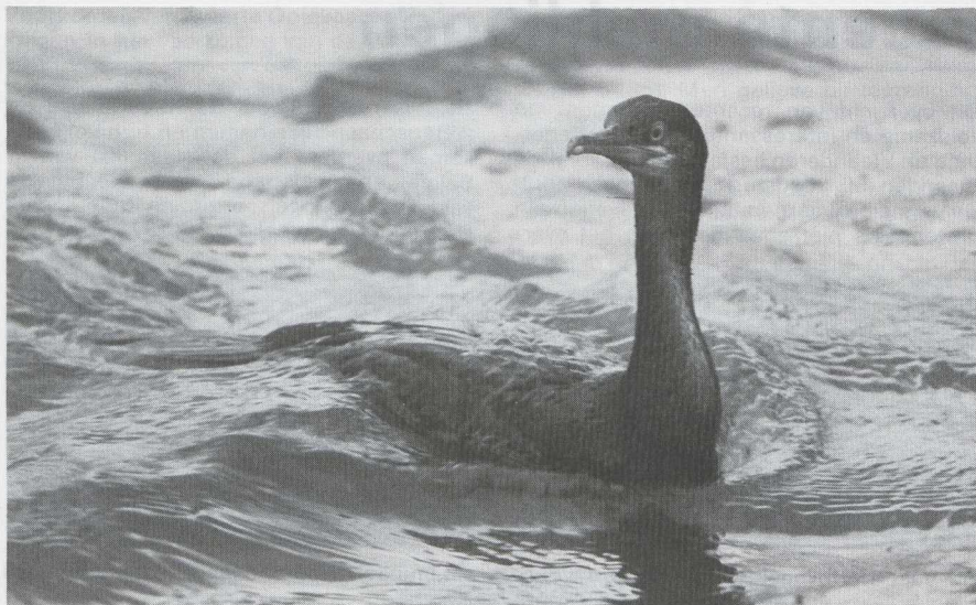
90-91 Kuifaalscholvers Phalacrocorax aristotelis in non-definitief (= onvolwassen) kleeed, IJmuiden, Noordholland, september 1983.