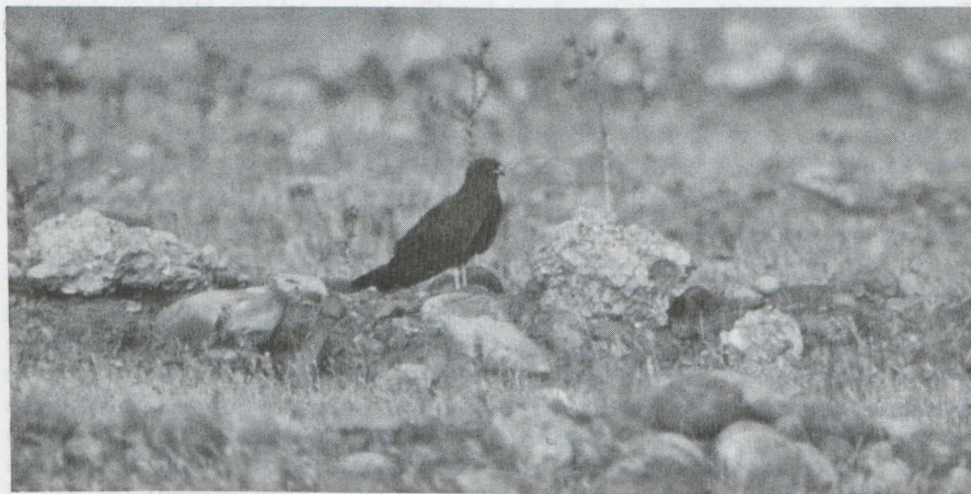
72-74 Melanistic Montagu's Harrier Circus pygargus , male, presumably in second calendar-year plumage, France, July 1982.

PLUMAGE Head: dark blackish-brown; nape slightly more umber. Upperparts: mantle, scapulars, back, rump and uppertail-coverts dark brown; few mantle-feathers and scapulars black; rump and uppertail-coverts with silvery-grey shade in certain light. Underparts: breast, flanks, thighs, belly, vent