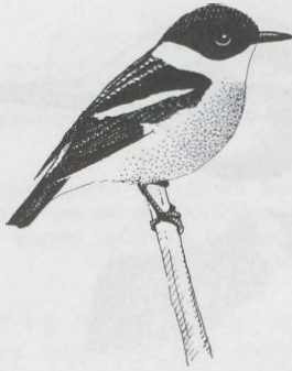
FIGURE 1 Hodgson's Stonechat Saxicola insignis , male, Nepal, march 1982.

Shan). The species may also breed in south-eastern Tibet. It winters in the plains of northern India from Haryana (Ambala) in the west to West Bengal (Jalpaiguri) in the east. However, winter records appear to be very scattered. The winter habitat is said to be heavy grassland, reeds and tamarisks along river beds, and cane fields (Ali & Ripley 1973, Vaurie 1972).