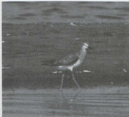
96-97 Kleine Geelpootruiter Tringa flavipes in eerste wisselkleed (= eerste zomerkleed), Doel, Oostvlanderen, augustus 1983 (Arnoud B van den Berg, Jef de Ridder & Chris Steeman).