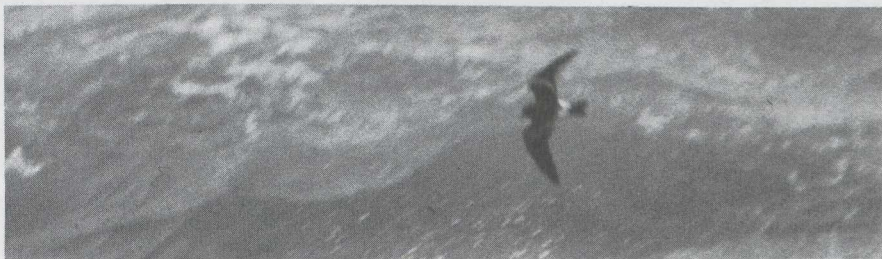
89 Vaal Stormvogeltje Oceanodroma leucorhoa , IJmuiden, Noordholland, september 1983.

zicht is niet volledig. De Nederlandse en wetenschappelijke namen en hun volgorde komen overeen met de 'Naamlijst van in België en Nederland waargenomen of vastgestelde vogelsoorten en hun ondersoorten' ( Wielewaal 47: 363-376, 1981).