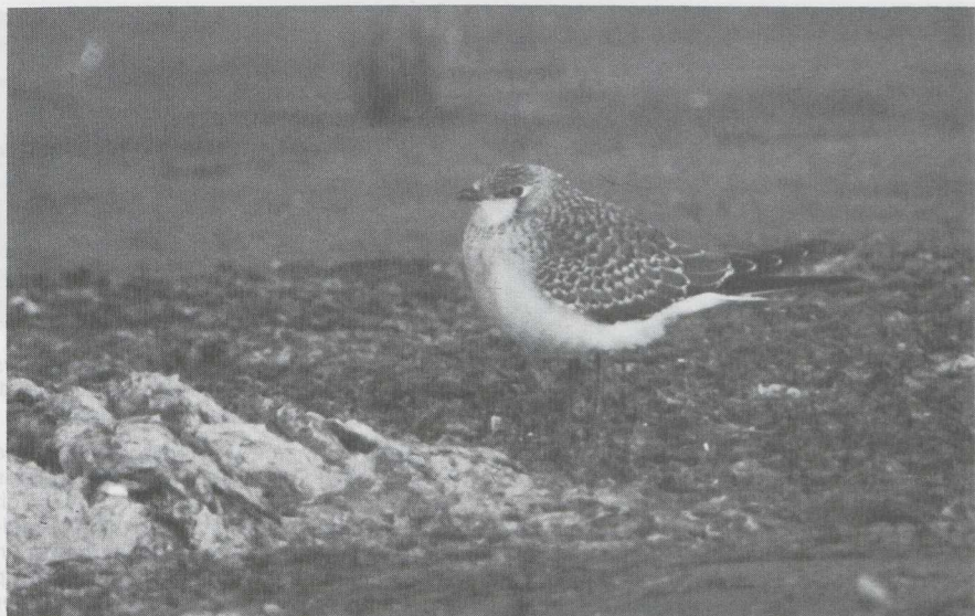
94 Steppevorkstaartplevier Glareola nordmanni in juveniel kleed, De Maasvlakte, Zuidholland, augustus 1983. 95 Amerikaanse Gestreepte Strandloper Calidris melanotos in definitief (= volwassen) kleed, botulismeslachtoffer, Kallø, Oostvlaanderen, augustus 1983.