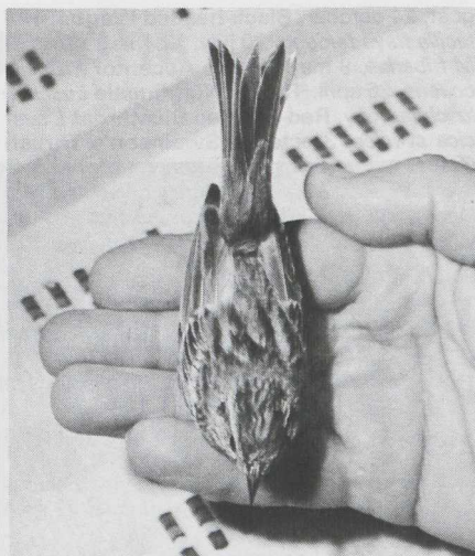
5 Yellow-breasted Bunting Emberiza aureola in non-definitive (= non-adult) plumage, Westenschouwen, Zeeland, september 1981 (L van Ree).

NOORDHOLLAND Bloemendaal, 22 october, female in first basic (= first-winter) plumage, trapped and photographed (T Belterman, R Kofman, R Luttkik).