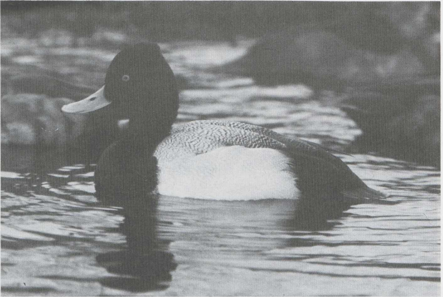
6 Lesser Scaup Aythya affinis , male in definitive alternate (= adult summer) plumage, 't Zand, Noordholland, in captivity, february 1983.

unicoloured pale blue-grey bill (only the nail is black). 2 The hindcrown-feathers are slightly elongated, forming a very short tassel. Lesser Scaup has a rather 'bumpy' head; this because of the somewhat elongated crown-feathers. Scaup has no elongated crown- or hindcrown-feathers. 3 The very dark black-brown head has a brownish-violet gloss. Lesser Scaup and Scaup have both a black head but in the latter with a predominantly greenish gloss and in the former with a violet one. 4 The whitish to pale grey mantle is finely vermiculated with black (as in Pochard). Lesser Scaup and Scaup have a much more coarsely vermiculated mantle. 5 The whitish sides and flanks are very finely vermiculated with dark (only perceptible at very close quarters). Usually, Lesser Scaup and Scaup have heavily vermiculated sides and flanks. 6 The terminal scapulars and tertials are pale. Lesser Scaup and Scaup have blackish ones. 7 The innermost secondaries are pale (forming the pale triangle at the terminal border of the flank). Lesser Scaup and Scaup have blackish ones. And 8 the iris is orangy. Lesser Scaup and Scaup have more yellow irides. The photograph of the hybrid was taken by Edward van IJzendoorn near Halfweg, Noordholland, in april 1982 when it was displaying to female Tufted Ducks.