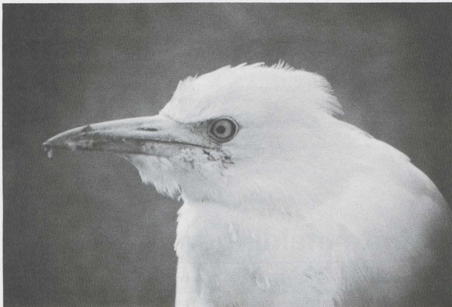
16 Koereiger Bubulcus ibis , Oene, Gelderland, februari 1983 (J W de Roever).

DUIKERS TOT IBISSEN IJsduikers Gavia immer werden waargenomen langs de Houtribdijk (2 januari) en op het Oostvoornse Meer Zh (22 januari). Op De Maasvlakte Zh verbleef de gehele periode een Kuifaalscholver Phalacrocorax aristotelis . Andere verschenen bij de Stevinsluizen Nh (22 januari) en te Oostende Wvl (11 februari). De Koereiger Bubulcus ibis van Oene Gld was de gehele periode aanwezig; hij liet zich voeren en werd bijzonder tam. Er verbleven Grote Zilverreigers Egretta alba bij Piaam Fr (twee) en in het Oostvaardersplassen-gebied Fl (twee); op 19 maart zat er bovendien een bij Zalk O. Een ongewoon grote groep van 34 Ooievaars Ciconia ciconia vloog boven Alblasserdam Zh op 7 maart. Er trokken op 12 maart vier over Spaarwoude Nh.