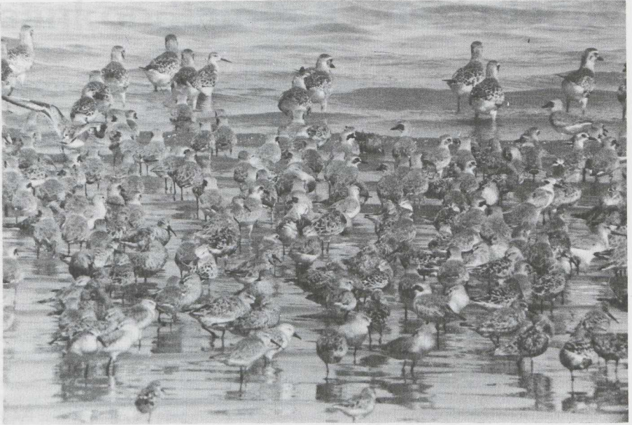
14 Mongoolse Plevier Charadrius mongolus , Woestijnplevier C leschenaultii , Zilverplevier Pluvialis squatarola , Drieteenstrandloper Calidris alba , Kleine Strandloper C minuta , Krombekstrandloper C ferruginea , Kempphaan Philomachus pugnax en Terekrutter Xenus cinereus , Mida Creek, Kenia, april 1982 (P B Taylor). Nog meer soorten?

dat direct aan de kust ligt. Wij brengen hier zes nachten door.