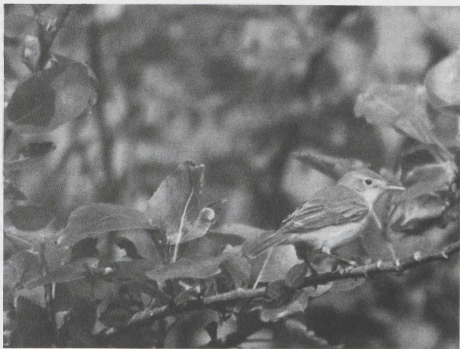
13 Orpheusspotvogel Hippolais polyglotta , De Maasvlakte, Zuidholland, mei 1982 (Eric Bos).

SCHARRINGA, C J G & OSIECK, E R 1981ab Zeldzame vogels in Nederland in 1979 & 1980. Limosa 54: 17-28; 127-136.