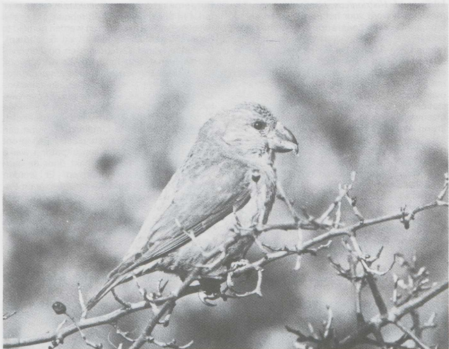
23 Grote Kruisbek Loxia pytyopsittacus , Koningshof, Noordholland, januari 1983.

LEEUWERIKEN TOT GORZEN Op 15 en 16 januari werd te Harderwijk Gld het eerste wintergeval van de Oeverzwaluw Riparia riparia voor Nederland vastgesteld. De Noordeuropese Waterspreeuw Cinclus cinclus cinclus van de AW-duinen Nh bleef tot eind februari. Een Bladkoninkje Phylloscopus inornatus over-