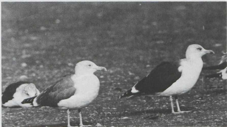
9 Yellow-legged Gull Larus cachinnans in definitive basic (= adult winter) plumage (middle) and two Lesser Black-backed Gulls L fuscus (left rear and right), IJmuiden, Noordholland, october 1982 (Arnoud B van den Berg).

On 29 october 1982 I studied and photographed a Yellow-legged Gull of the subspecies L c michahellis in definitive basic (= adult winter) plumage at IJmuiden, Noordholland. It was standing on the beach next to Lesser Black-backed L fuscus of the subspecies L f graellsii and Herring Gulls L argentatus of the subspecies L a argenteus in definitive basic plumage. The bird was only slightly larger than both Lesser Black-backed and Herring. The grey of the upperparts was intermediate between that of Lesser Black-backed and Herring and similar to that of Common Gull L canus (of the subspecies L c canus ) in definitive basic plumage. There was more black on the outer six primaries than in Herring. Unlike Lesser Black-backed and Herring in definitive basic plumage, it had hardly any dusky streaking on head and neck. The impression of having a smaller eye than both Lesser Black-backed and Herring was due to the lack of dusky feathering around the eye and to the thicker appearance of the neck. The pale grey-yellow iris was less yellow than in Lesser Black-backed and Herring. The red orbital ring was similar to that of Lesser Black-backed. The bill looked slightly heavier with the tip of the upper mandible more curved vertically downwards. Both bill and legs were paler yellow than in Lesser Black-backed; the bill was richer coloured than in Herring.