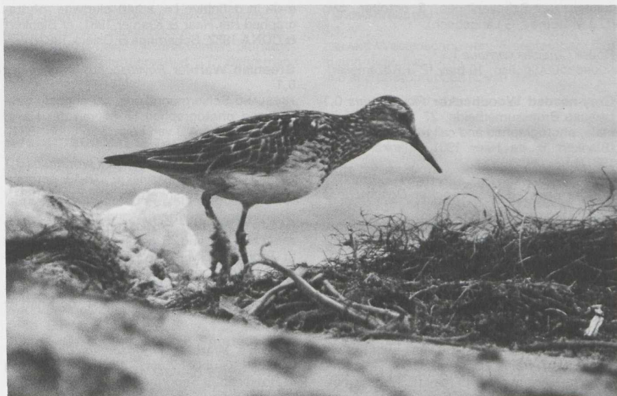
4 Pectoral Sandpiper Calidris melanotos in alternate (= summer) plumage, Huizen, Noordholland, august 1981 ( C J Breek ).

Iceland Gull Larus glaucooides 1,4 NOORDHOLLAND Camperduin, 19 april, bird in first basic (= first-winter) plumage (J Apperloo, P Bison, N F van der Ham). IJmuiden, 17 january to 5 march, bird in second or third basic (= second- or third-winter) plumage, photographed (van IJzendoorn & Oreel 1981). IJmuiden, 24 february, bird in first basic (= first-winter) plumage, photographed (van IJzendoorn & Mulder 1981). ZUIDHOLLAND De Maasvlakte, 12 december, bird in first basic (= first-winter) plumage (J Palm, R Schenk, P G Schrijvershof).