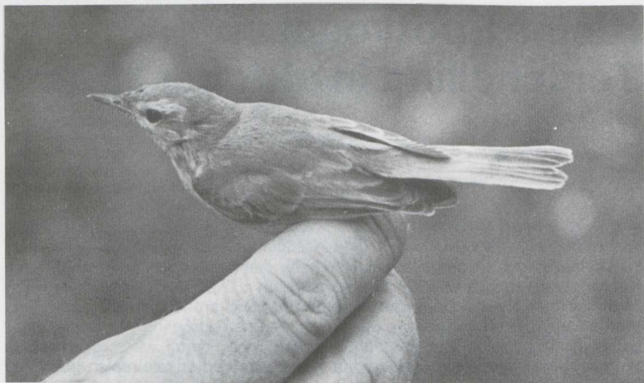
1-2 Kleine Spotvogel Hippolais caligata , Terschelling, Friesland, oktober 1982 (René Pop).