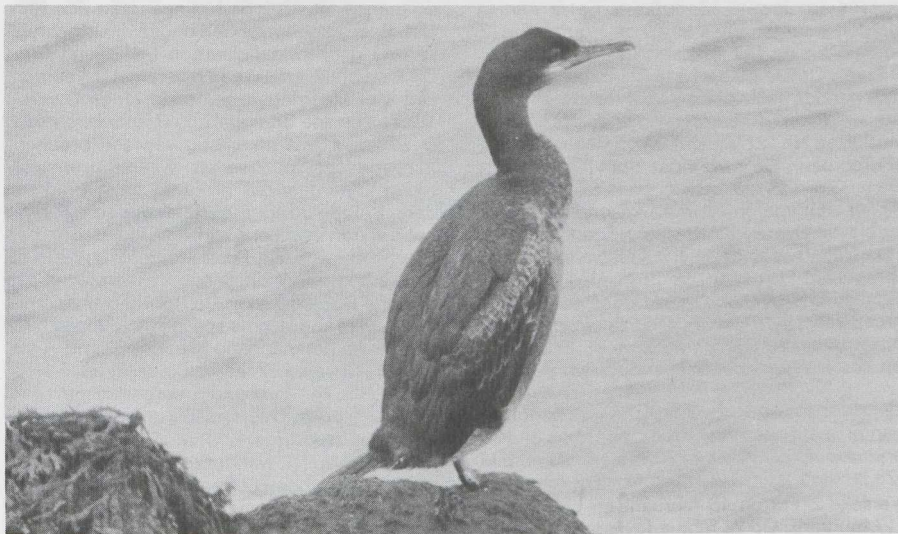
15 Kuifaalscholver Phalacrocorax aristotelis , De Maasvlakte, Zuidholland, maart 1983 ( René Pop ).

De Nederlandse en wetenschappelijke namen en hun volgorde komen overeen met de 'Naamlijst van in België en in Nederland waargenomen of vastgestelde vogelsoorten en hun ondersoorten' ( Wielewaal 47: 363-376, 1981).