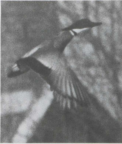
17 Bronskopeend Anas falcata , mannetje, Makkum, Friesland, maart 1983 (Jan Mulder).