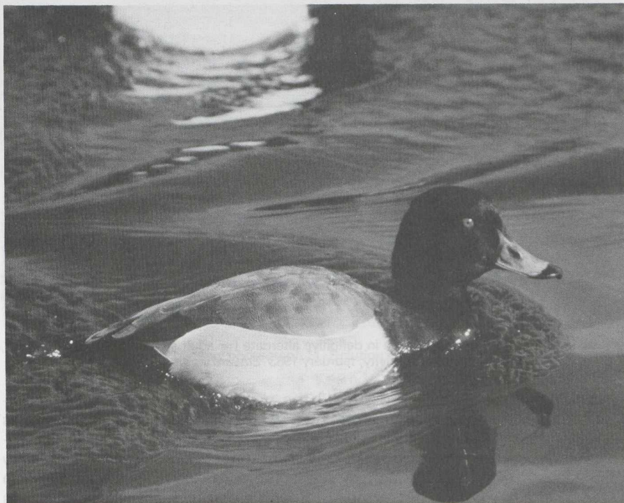
Pochard Aythya ferina x Tufted Duck A fuligula , male in definitive alternate (= adult summer) plumage, Halfweg, Noordholland, april 1982 (Edward J van IJzendoorn).

10 The male Aythya duck in definitive alternate (= adult summer) plumage in plate 79 ( Dutch Birding 4: 132, 1982) is a hybrid of the 'Lesser Scaup' type. This hybrid between a Pochard A ferina and a Tufted Duck A fuligula looks very like a Lesser Scaup A affinis (hence the hybrid's name). It also looks like a Scaup A marila . When studying the photograph of the hybrid, the following differences with male Lesser Scaup and Scaup in definitive alternate plumage can be noted. 1 The bill is blue-grey, lightening distally, with a broad black terminal band. Lesser Scaup and Scaup have an