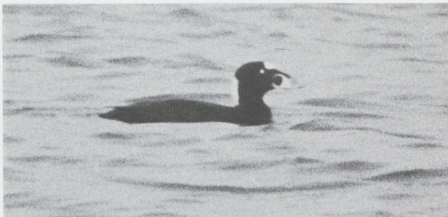
8 Surf Scoter Melanitta perspicillata , male in definitive alternate (= adult summer) plumage, Eemshaven, Groningen, november 1982 (Richard Vaughan).

60 m of us, proclaimed its identity without any doubt: it was an adult drake Surf Scoter Melanitta perspicillata . We watched the bird on and off for some hours. No white was visible on the wings; they were opened on one occasion. It seemed in excellent condition, showing no sign of oiling, and was frequently seen to dive. The bird stayed until 3 december (the photograph reproduced here was taken on 27 november).