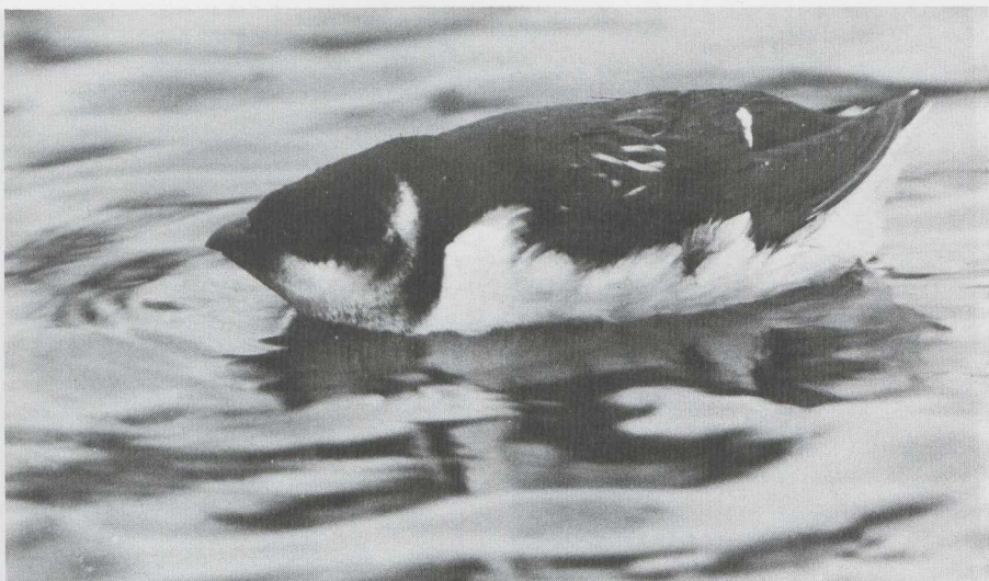
20 Kleine Alk Alle alle , Amsterdam-West, Noordholland, januari 1983 ( Jan Mulder ). 21 Bladkoninkje Phylloscopus inornatus , Delftse Hout, Zuidholland, februari 1983 ( René van Rossum ).