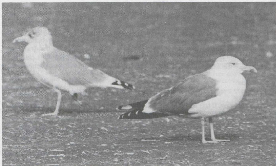
12 Yellow-legged Gull Larus cacchinnans in definitive basic (= adult winter) plumage (right) and Herring Gull L. argentatus (left), IJmuiden, Noordholland, october 1982 (Arnoud B van den Berg).

There were no Herring Gulls of the subspecies L. a. argentatus in definitive (= adult) plumage present for comparison. This subspecies is a common winter visitor to the Netherlands from at least early december onwards ( pers obs ). L. a. argentatus of the more northern parts of its range can be distinguished from L. a. argentatus in definitive plumage by the slightly larger size and the darker grey of the upperparts (about as grey as in Common Gull). Yellow-legged Gull in definitive plumage can be distinguished from northern L. a. argentatus with yellow or yellowish legs by the reduced dusky basic (= winter) streaking on head and neck, generally more black and less white on the primaries, the red orbital ring, and the richer coloured bill and legs. Yellow-legged has on the average a greater projection of the closed wing-tips beyond the tail and longer legs than Herring. Vocally, it is more similar to Lesser Black-backed than Herring Gull.