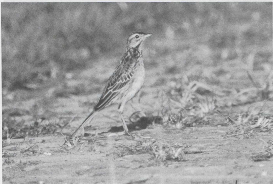
7 Mystery photograph 11. Solution in next issue.