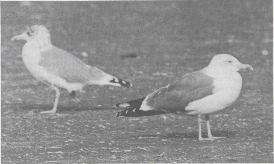
12 Yellow-legged Gull Larus cacchinnans in definitive basic (= adult winter) plumage (right) and Herring Gull L. argentatus (left), IJmuiden, Noordholland, october 1982 (Arnoud B van den Berg).

There were no Herring Gulls of the subspecies L. a. argentatus in definitive (= adult) plumage present for comparison. This subspecies is a common winter visitor to the Netherlands from at least early december onwards ( pers obs ). L. a. argentatus of the more northern parts of its range can be distinguished from L. a. argentatus in definitive plumage by the slightly larger size and the darker grey of the upperparts (about as grey as in Common Gull). Yellow-legged Gull in definitive plumage can be distinguished from northern L. a. argentatus with yellow or yellowish legs by the reduced dusky basic (= winter) streaking on head and neck, generally more black and less white on the primaries, the red orbital ring, and the richer coloured bill and legs. Yellow-legged has on the average a greater projection of the closed wing-tips beyond the tail and longer legs than Herring. Vocally, it is more similar to Lesser Black-backed than Herring Gull.