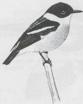
FIGURE 1 Hodgson's Stonechat Saxicola insignis , male, Nepal, march 1982.

Shan). The species may also breed in south-eastern Tibet. It winters in the plains of northern India from Haryana (Ambala) in the west to West Bengal (Jalpaiguri) in the east. However, winter records appear to be very scattered. The winter habitat is said to be heavy grassland, reeds and tamarisks along river beds, and cane fields (Ali & Ripley 1973, Vaurie 1972).