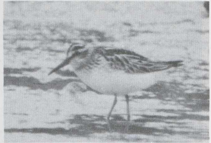
98 Breedbekstrandloper Limicola falcinellus in juveniel kleed, Serooskerke, Zeeland, augustus 1983.

De waarnemingen van twee verschillende Reuzensterns op Texel op 25 augustus waren het derde en vierde geval voor dit waddeneiland. Maximaal zes Witvleugelsterns Chlidonia leucopterus verbleven in Flevoland. Andere werden waargenomen op het Balgzand in augustus en september (minstens twee), op Marken Nh op 12 augustus (zes), bij Den Oever op 6 en 20 augustus en te Serooskerke in de derde week van augustus.