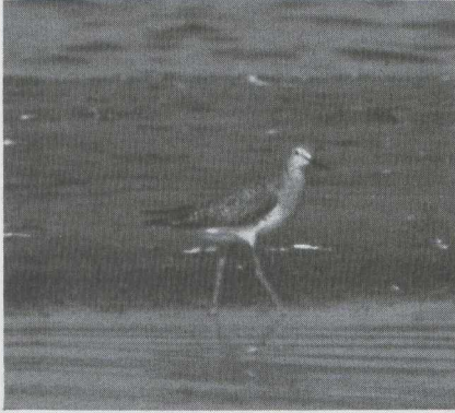
96-97 Kleine Geelpootruiter Tringa flavipes in eerste wisselkleed (= eerste zomerkleed), Doel, Oostvlanderen, augustus 1983 (Arnoud B van den Berg, Jef de Ridder & Chris Steeman).