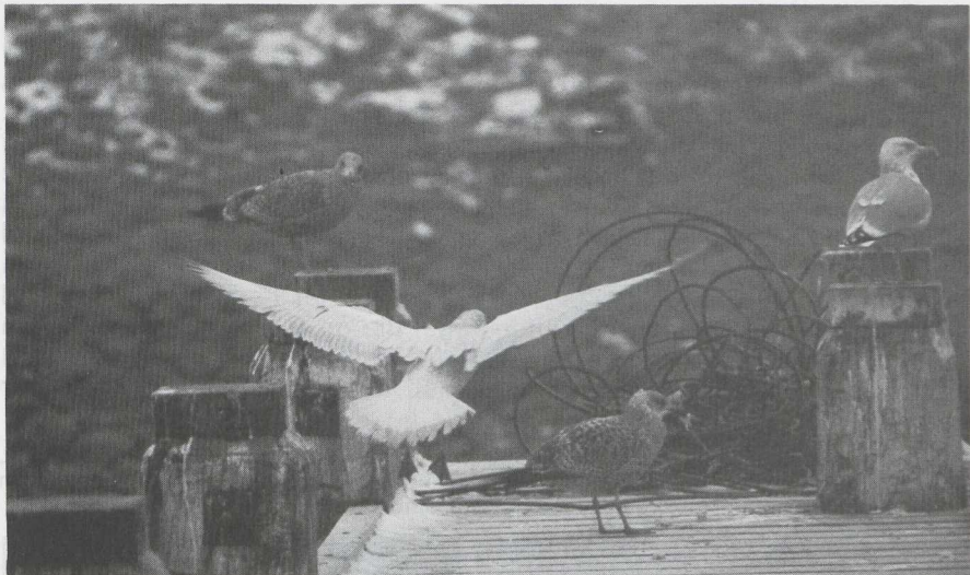
81 Leucistische Zilvermeeuw Larus argentatus in eerste basiskleed (= eerste winterkleed), IJmuiden, Noordholland, februari 1983. 82 Grote Burgemeester L hyperboreus in eerste basiskleed, pikkend naar Zilvermeeuw, IJmuiden, februari 1983.