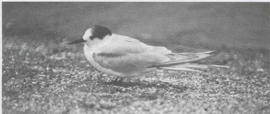
110 Visdief Sterna hirundo in eerste wisselkleed (= eerste zomerkleed), Harlingen, Friesland, juni 1982 (Joop Jukema).

van een vogel in definitief wisselkleed, bij de andere drie was de staart kort. De vogels konden van de Noordse Stern S paradisaea worden onderscheiden door de aanwezigheid van verschillende generaties handpennen.