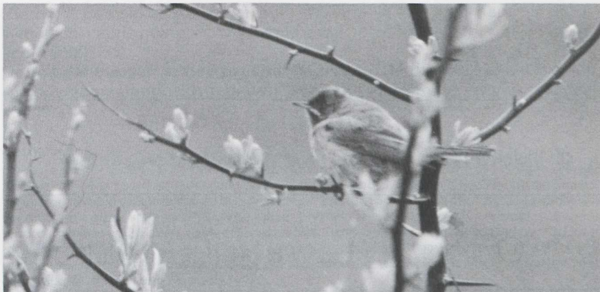
111 Baardgrasmus Sylvia cantillans , mannetje, Maasvlakte, Zuidholland, mei 1983 (Edward J van IJzendoorn).