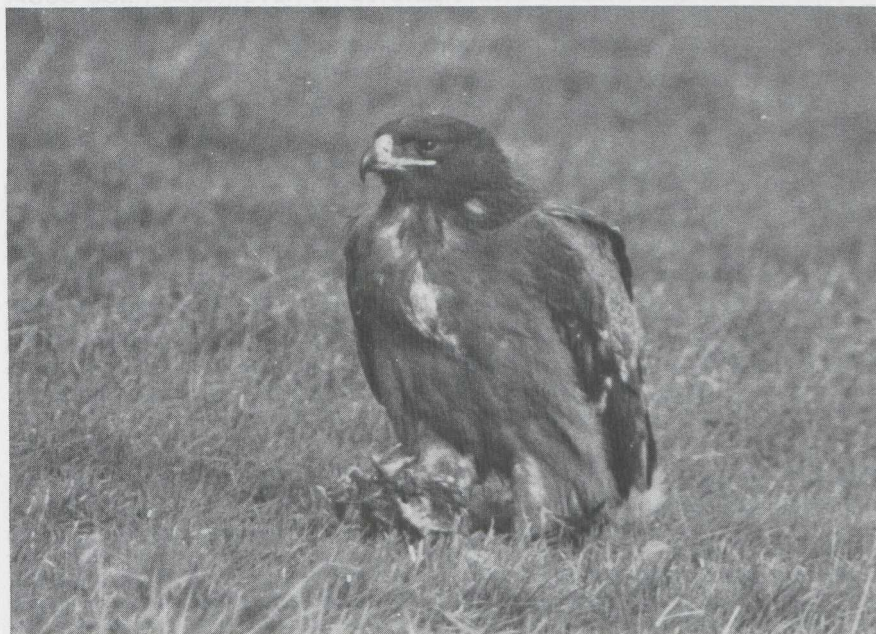
105 Steppearend Aquila rapax , Someren, Noordbrabant, januari 1984 (René Pop).

Op grond van structuur, verenkleed, geografische verspreiding en trekgedrag betrof het in dit geval zeer waarschijnlijk een Steppearend uit de nipalensis -groep en wel A r orientalis .