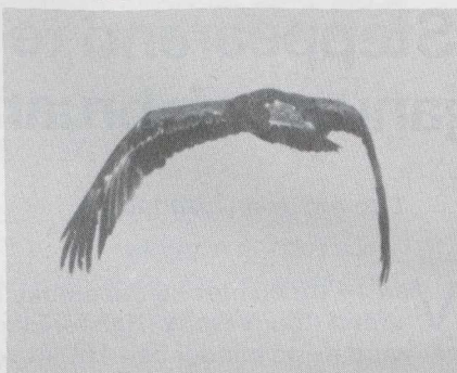
102 Steppearend Aquila rapax , Someren, Noordbrabant, januari 1984 (Jan Mulder).

blauwgrijs met zwarte punt; washuid en mondhoek heldergeel. Tenen heldergeel.