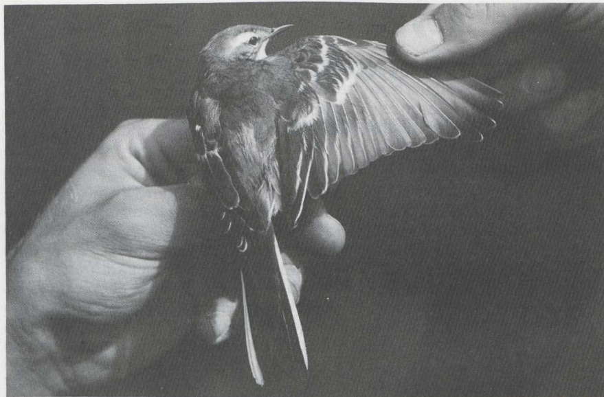
106 Citroenkwikstaart Motacilla citreola , Castricum, Noordholland, augustus 1984 (Hans Schekkerman).

BOVENDELEN Mantel en schouder donker zachtgrijs met bruine zweem. Rug en stuit donkergrijs zonder bruine zweem; langste stuitveren met duidelijke smalle zwarte top-randjes. Bovenstaartdekveren vrijwel egaal zwart.