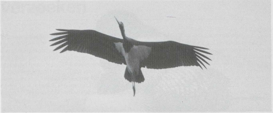
121 Zwarte Ooievaar Ciconia nigra , Knardijk, Flevoland, augustus 1984.

september (25). Een attractie voor talloze vogelaars was een Steltkluut Himantopus himantopus die van 9 tot 24 augustus rondstapte in de Keersluisplas Fl, Op 24 juli werd een exemplaar waargenomen te Wolphaartsdijk Z en rond 1 augustus drie boven Utrecht U. Een Griël Burhinus oedecnemus werd op 29 augustus langs de Brielsegatdam Zh aangetroffen. Veel vogelaars die tussen 18 en 27 augustus de vaak verre reis ondernamen naar het Amerlanderduin op de oostpunt van Terschelling, werden beloofd met het zien van een mannetje Woestijnplevier Charadrius leschenaultii in definitief wisselkleed. Dit was het tweede geval voor Neder-