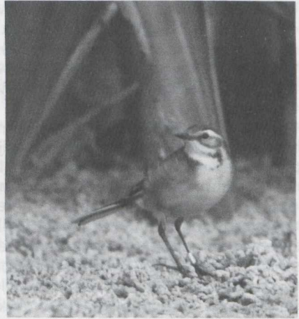
107-108 Citroenkwikstaart Motacilla citreola , Castricum, Noordholland, september 1984.

GEDRAG Rustig foeragerend zonder sprintjes en sprongetjes, en vliegende insecten niet achtervolgend. In tegenstelling tot Witte Kwikstaart M alba en Gele Kwikstaart gewoonlijk in dichte vegetatie vertoevend; na loslaten sluipend tussen lage braam- en kruipwilgbegroeiing foeragerend, later in dichte lisdoddevegetatie langs oever verblijvend en herhaaldelijk op drijvende velden darmwier foeragerend. Soms met staart kwikkend. Af en toe vleugels afhankelijk en kruin opzettend (vaak gevolgd door zich uitschudden en veren rangschikken).