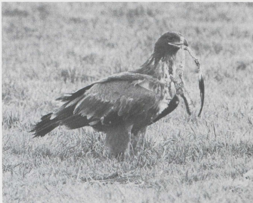
104 Steppearend Aquila rapax , Someren, Noordbrabant, januari 1984.

van de donkere bovenkop en nek en de egaal gekleurde onderdelen hoewel door regen nat en plakkerig geworden veren de onderdelen een gevlekte indruk konden geven. De grote snavel, de vorm van het neusgat, de ver naar achteren doorlopende mondhoek, de lichte basis van de handpennen, de vrij lichte middelste en kleine dekveren en onderdekveren en het lichte venster vormden aanvullende kenmerken welke pasten op een Steppearend en waarmee, al dan niet in combinatie met elkaar, andere soorten konden worden uitgesloten (cf Cramp & Simmons 1980, Porter et al 1981). Alleen de lichte stuit was niet precies in overeenstemming met hetgeen wordt vermeld voor een Steppearend en wees meer op een lichte Bastaardarend A clanga of jonge Keizerarend. Beide werden echter door de overige genoemde kenmerken uitgesloten. Gezien de kracht waarmee deze kenmerken voor Steppearend pleitten, werd aan de wat licht uitgevallen stuit niet al te veel betekenis toegekend.