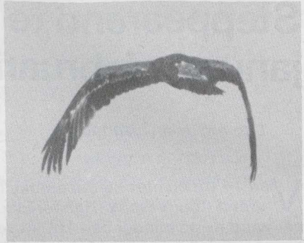
102 Steppearend Aquila rapax , Someren, Noordbrabant, januari 1984 (Jan Mulder).

blauwgrijs met zwarte punt; washuid en mondhoek heldergeel. Tenen heldergeel.