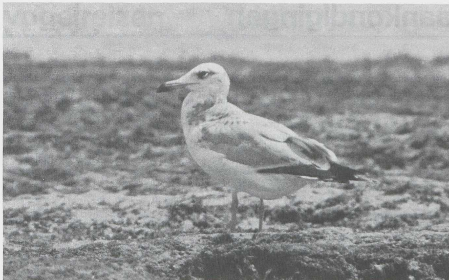
23 Reuzenzwartkopmeeuw Larus ichthyaetus in tweede basiskleed (= tweede winterkleed), Kenia, januari 1984 (Jan Mulder).

DBA-vogeldag op 4 februari 1984 te Antwerpen Op zaterdag 4 februari 1983 vond van 15:30 tot 21:00 te Antwerpen A de tweede door de stichting Dutch Birding Association georganiseerde vogeldag plaats. Er waren 100+ belangstellenden in het Rijks Universitair Centrum Antwerpen aanwezig. Het programma begon met een diaverslag van een vogelreis naar Mongolië en Siberië door Jowi de Roever. Daarna belichtte Arnoud van den Berg het voorkomen van de Duponts Leeuwerik Chersophilus duponti in Spanje. Ook ging hij in op de herkenning van deze geheimzinnige soort. Na de pauze volgde een lezing door Edward van IJzendoorn over de topografie van vogels. Vervolgens toonde Peter de Knijff een leerzame serie 'mystery birds' gevolgd door een bespreking van de kenmerken van de getoonde soorten. De dag werd besloten met een dialoog door Han Blankert over een aantal zeldzame en interessante vogels uit de afgelopen jaren uit België en Nederland.