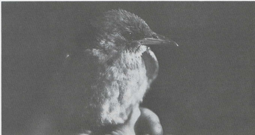
34 Rose Spreeuw Sturnus roseus in juveniel kleed, Vlieland, Friesland, september 1983 (H M van Eck).

november werd een Cetti's Zanger Cettia cetti gehoord te Ploegsteert Wvl. Drie Waaierstaartrietzangers Cisticola juncidis werden waargenomen op 22 oktober en 5 en 12 november te Antwerpen-Blokkersdijk A. Op 10 oktober zat er een Sperwergasmus Sylvia nisoria in Alkmaar Nh en op 30 oktober werd er een gevangen te Wasse naar Zh. Er waren drie gevallen van de Pallas' Boszanger Phylloscopus proregulus : een waarneming te Scheveningen Zh op 2 oktober en vangsten op Ameland Fr en te Haskerhorne Fr op 29 oktober. Ongeveer 10 Bladkoninkjes P inornatus werden gemeld. Zo waren er vogels op Ameland, te Castricum (vangst op 21 oktober), op de Maasvlakte, te Oostvoorne Zh (vangst op 21 oktober) en op Terschelling (minstens drie exemplaren van 7 tot 14 oktober en een vangst op 15 oktober). Opmerkelijk was de vangst van een Bladkoninkje te Loosdrecht U op 9 oktober. Kleine Vliegenvangers Ficedula parva verschenen op Ameland op 8 (twee vangsten) en 18 oktober (vangst), op de Maasvlakte op 29 oktober en op Terschelling van 11 tot 15 oktober. Twee Taigaboomkruipers Certhia familiaris werden gevangen: op 5 okto-