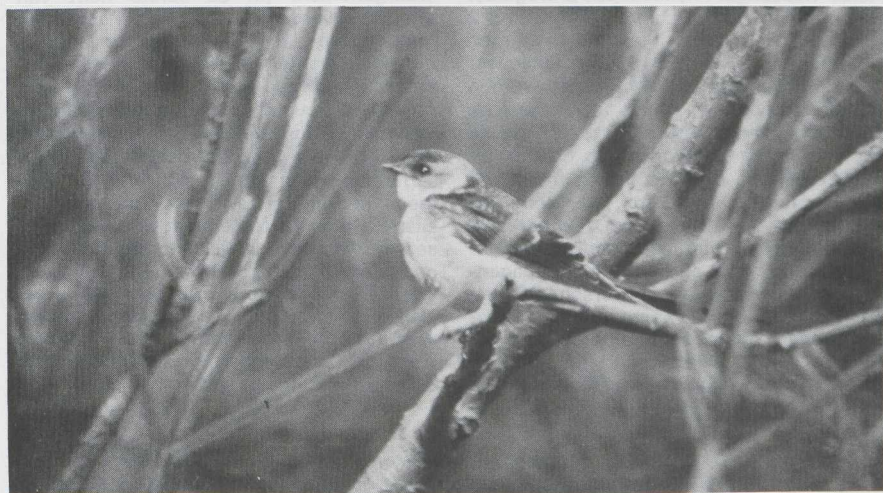
32 Kleine Vliegenvanger Ficedula parva in juveniel kleeid, Maasvlakte, Zuidholland, oktober 1983 (René Pop). 33 Roodstuitzwaluw Hirundo daurica in juveniel kleeid, Anjum, Friesland, oktober 1983 (Peter Venema).

novaeseelandiae . Op 8 november werd er een late op Schiermonnikoog waargenomen. Bovendien was er op 23 november nog een melding langs de Torenvalkweg in Flevoland. Te Westenschouwen Z werd op 13 november een bijzonder interessante pieper gevangen. Verder onderzoek zal moeten uitwijzen of het vermoeden juist is dat het een Blyths Pieper A godlewskii is geweest. De vogel bevindt zich thans in het Zoölogisch Museum te Amsterdam. De Blyths Pieper broedt in Centraal-Azië en is tot nu toe slechts twee keer in Europa vastgesteld. Uitzonderlijk laat was het verblijf van een juveniele Duinpieper A campestris van 12 november tot 10 december in het Westelijk Havengebied van Amsterdam. Op 2 oktober werd te Camperduin een Roodkeelpieper A cervinus waargenomen. Een Pestvogel Bombycilla garrulus verbleef op 13 november in Hoogezand Gr terwijl er op 20 november zeven in Makum zaten. Vanaf 13 oktober verbleef er weer een Waterspreeuw Cinclus cinclus in de AW-duinen. Op 29 oktober werd een te Birdaard Fr waargenomen. Een mannetje Blauwstaart Tarsiger cyanurus liet zich op 4 november bestuderen te Etterbeek B. Dit zou het eerste geval voor België zijn en het tweede voor de Benelux. Op 13