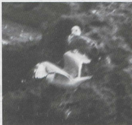
45-46 Ring-billed Gull Larus delawarensis in second alternate (= second summer) plumage, Morocco, April 1983.

SIZE Smaller than Yellow-legged Gull; presumably about size of Common Gull L canus (though no direct comparison). Bill stout and prominent. Leg longish.