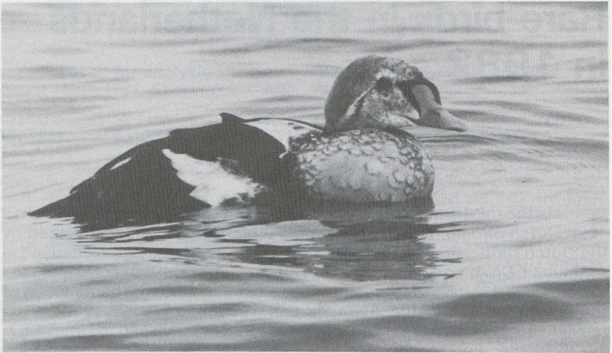
37 King Eider Somateria spectabilis , male in second basic (= second winter) plumage, IJmuiden, Noordholland, February 1982 ( Jan Mulder ).

Glossy Ibis Plegadis falcinellus 0,1 GRONINGEN Hoogkerk, 28-29 October (P G Schrijvershof, H J Wight et al ).