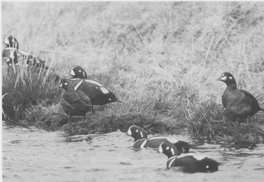
36 Harlequin Duck Histrionicus histrionicus , males and females in definitive alternate (= adult summer) plumage, Iceland, June 1978 (Hans Schouten).