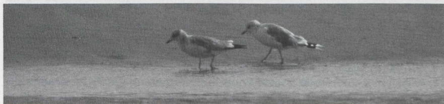
49 Stormmeeuw Larus canus in tweede basiskleed (= tweede winterkleed) en definitief basiskleed (= volwassen winterkleed), Schiermonnikoog, Friesland, augustus 1983.

Atypische Stormmeeuw op Schiermonnikoog in augustus 1983 Op 25 augustus 1983 zagen Ger Blok en Karel Mauer op het strand van Schiermonnikoog Fr een Stormmeeuw Larus canus die niet direct als zodanig werd herkend. Atypisch waren een donkere halve kopkap, ge-