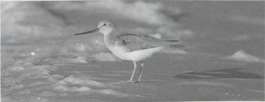
65 Terek Ruyter Xenus cinereus , Huizen, Noordholland, juni 1985 (Ger Blok).

28 mei zou in hetzelfde gebied ook een mannetje Kleinst Waterhoen P pusilla hebben geroepen. Op verschillende plaatsen werden in april en mei Kraanvogels Grus grus waargenomen. In de Oostvaardersplassen werd in mei enkele malen een Steltkluit Himantopus himantopus gezien. Grielen Burhinus oedichnemus verschenen te Vlaardingen Zh op 16 april en in de AW-duinen Nh op 21 april. Op de vlasakkers in Zuidelijk Flevoland waren in mei weer Morinelplevieren Charadrius morinellus te vinden; het hoogste aantal (43+) werd geteld op 19 mei. De Amerikaanse Gestreepte Strandloper Calidris melanotos lijkt een regelmatige verschijning te worden: er waren waarnemingen in