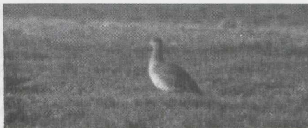
57-58 Kleine Trap Tetrax tetrax , Lage Zwaluwe, Noordbrabant, februari 1983 (Paul G Schrijvershof, Peter de Knijff).

veren wit. Overige dekveren bruin met zwarte en witte streepjes. Grote handdekveren zwart.