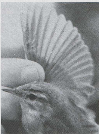
81 Veldrietzanger Acrocephalus agricola , Makkum, Friesland, oktober 1984.

BIOMETRIE Vleugellengte 56 mm; vleugel-formule p4 langste, p2 -5,25 mm (korter dan langste), p3 -0,25 mm, p5 -1 mm, p1 +2 mm langer dan langste handdekveer; p2 reikte tussen p7 en p8, dichter bij laatste; versmalling binnenvlag p2 minimaal 11 mm. Staartlengte 52 mm; staartafronding minimaal 8 mm. Snavellengte tot bevedering 9,7 mm, tot schedelbasis 15,5 mm. Gewicht 11 g (8:00). Alle maten bepaald volgens Perdeck & Speek (zonder datum).