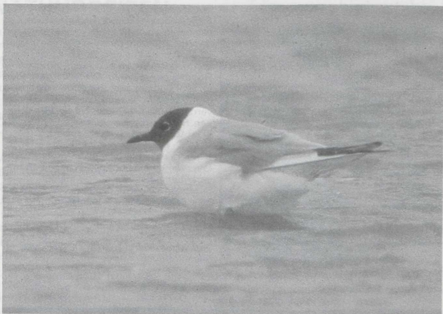
96 Kleine Kokmeeuw Larus philadelphia , IJmuiden, Noordholland, augustus 1985. 97 Witvleugelstern Chlidonias leucopterus en Zwarte Sterns C niger , Oostvaardersdijk, Zuidelijk Flevoland, augustus 1985.

Texel op 22 september. In de laatste week van september begon zich een ware invasie van Bladkoninkjes Phylloscopus inornatus af te tekenen. In deze periode werden er al meer dan 10 waargenomen. Van oostelijke herkomst was ook de Tjiftjaf P collybita tristis die werd gevangen in De Kennemerduinen op 30 september. Kleine Vliegenvangers Ficedula parva verschenen in de Eemshaven op 22 september, te Castricum op 25 september, te Westkapelle op 29 september en te Haarlem Nh op 30 september. Gedurende de gehele periode waren er enkele Buidelmezen Remiz pendulinus te vinden langs de Knardijk. Twee Buidelmezen werden gevangen te Lelystad op 17 augustus en een langstreckend exemplaar werd waargenomen te Den Oever. Op 15 september werd een juveniele Rose Spreeuw Sturnus roseus gemeld in de AW-duinen Nh. Dwerggorzen Emberiza pusilla werden gezien in de Eemshaven op 10 september en gevangen in de AW-duinen op 11 september en in De Kennemerduinen op 23 september.