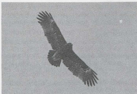
79 Spotted Eagle Aquila clanga , India, January 1979.

judge. For separating Lesser Spotted and Spotted, it is therefore necessary to study their plumage.