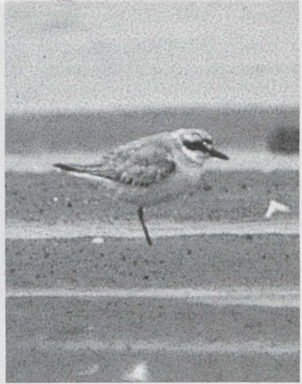
90 Steppevorkstaartplevier Glareola nordmanni , Castricum, Noordholland, augustus 1985 (Arnold Meijer). 91 Woestijnplevier Charadrius leschenaultii , Den Oever, Noordholland, augustus 1985 (René Pop). 92 Grauwe Franjepoot Phalaropus lobatus , IJmuiden, Noordholland, september 1985 (René van Rossum).