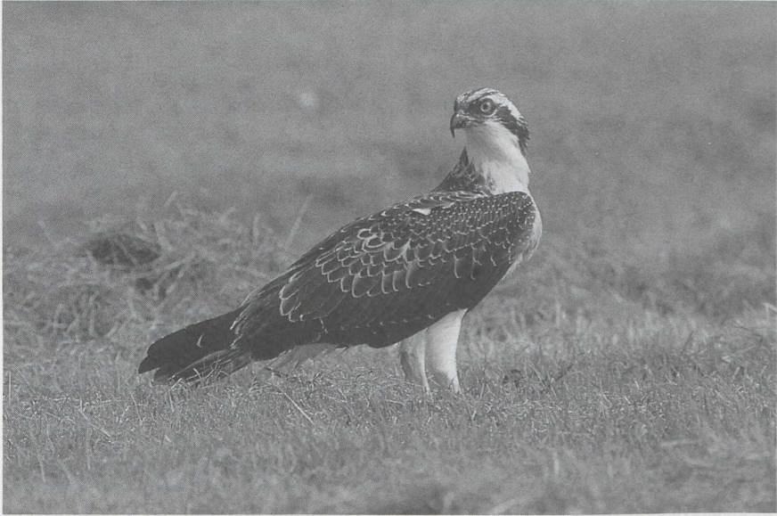
89 Visarend Pandion haliaetus , Petten, Noordholland, augustus 1985 (Hans Roersma).

manni werden geobserveerd te Deventer O op 19 augustus en te Castricum Nh van 22 tot 29 augustus. 10-tallen belangstellenden trokken naar de waddijk bij Den Oever Nh waar van 7 tot 30 augustus een Woestijnplevier Charadrius leschenaultii verbleef (of was het toch een Mongoolse Plevier C mongolus ?). Op de inmiddels traditionele verzamelplaats van Morinelplevieren C morinellus op de Maasvlakte Zh werden in de eerste week van september maar liefst 40 exemplaren geteld. Morinellen werden ook gezien te Westkapelle Z op 19 augustus en te Kalmthout op 25 augustus (twee). Amerikaanse Gestreepte Strandlopers Calidris melanotos verbleven in Zuidelijk Flevoland op 26 juli, in de Flauwers Inlaag Z van 26 juli tot 5 augustus en te Sint Kruis-Winkel Ovl van 5 tot 9 augustus. Poelruiters Tringa stagnatilis waren er te Kalmthout op 3 juli, bij Antwerpen in de eerste week van juli (drie), in Zuidelijk Flevoland op 17 juli en op 24 en 25 augustus, te Beerse van 21 tot 26 augustus en te Antwerpen op 15 september. De waarneming van een Terekruiter Xenus cinereus in de Oostvaardersplassen op 11 juli was de derde Nederlandse