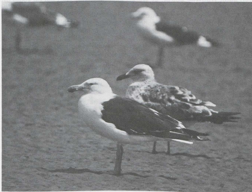
80 Kelp Gull Larus dominicanus , Kenya, January 1984 (Jef de Ridder).

Kelp Gull in Kenya in January 1984 On 2 January 1984, on the beach at Malindi, Kenya, Jef de Ridder photographed a large dark-backed gull. It was identified from the taken photograph as an adult Kelp Gull Larus dominicanus in summer plumage. The gull's most striking features were its thick bill with pronounced orange gonys, white head without any markings, small dark eye and greenish-yellow legs. The colour of the mantle was as dark as in nearby Lesser Black-backed Gulls L fuscus of subspecies L f fuscus . The following description is based on the colour transparency.