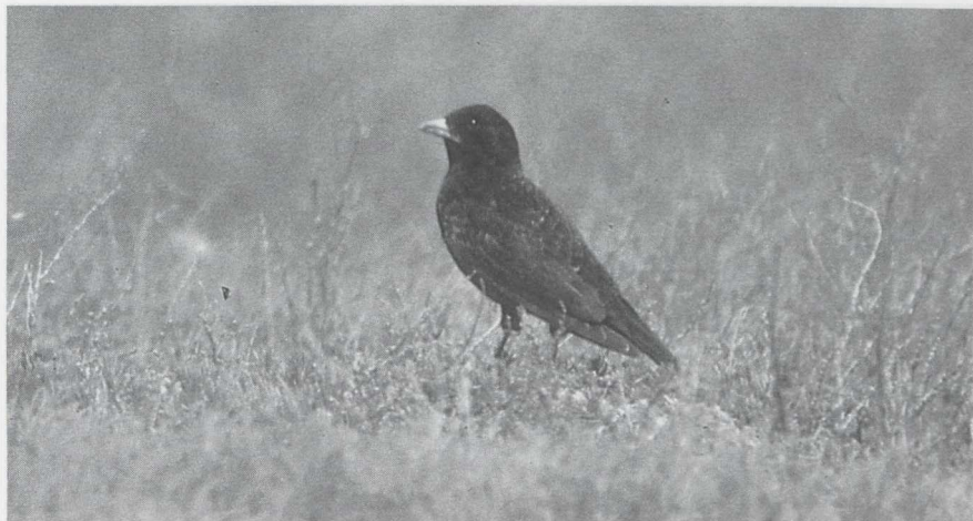
85 Zwarte Leeuwerik Melanocorypha yeltoniensis , mannetje, Kazachstan, juni 1985 (Huub Huneker).