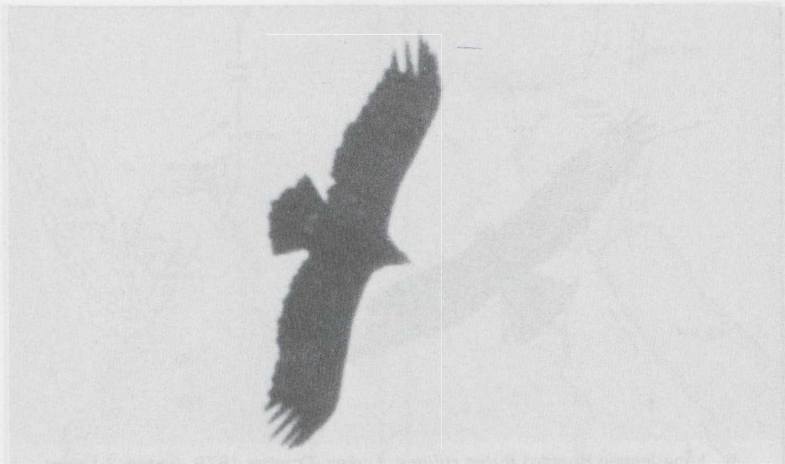
6 Spotted Eagle Aquila clanga , Iran, October 1978 (Arnoud B van den Berg).

Spotted or Steppe Eagles. Plumage characters were often not seen but quite often it was possible to distinguish between Lesser Spotted and Steppe by silhouettes alone. This was easiest when they were soaring on straight held wings, Steppe showing its characteristic long slender wings with obvious 'square' wing-tip and short inner primaries giving a distinct S-curve to the trailing edge. When gliding, with carpal joint held forwards and primaries backwards, identification by silhouette usually was more difficult but the wing-tip of Steppe is more pointed and reaches further back than in Lesser Spotted.