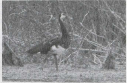
8-9 Spur-winged Goose Plectropterus gambensis , Morocco, June 1984.

GENERAL APPEARANCE & STRUCTURE Large, strongly built goose-like bird with broad wings and long legs and neck. Bare skin on forehead.