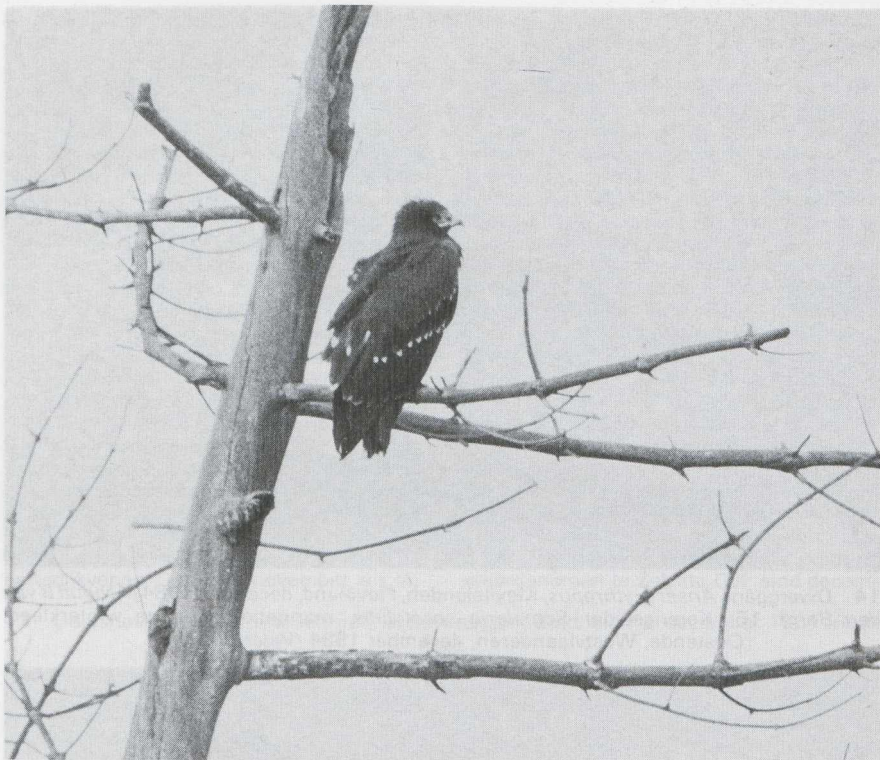
16 Schreeuwarend Aquila pomarina in juveniel kleed, Katwijk aan Zee, Zuidholland, november 1984.

ber zou een vrouwtje zijn gezien in de Braakmanpolder Z. Witoogenden A nyroca pleisterden onder andere op het Alkmaardermeer Nh van 21 tot eind oktober, te Halfweg van 30 oktober tot 6 november, te Minderhout A vanaf 15 november, te Lelystad Fl op 13 december en te Duffel A van 28 december tot 2 januari. Verrassend was de ontdekking van een mannetje Koningseider Somateria spectabilis in eerste winterkleed die vanaf 13 december te Oostende Wvl verbleef. Dit was het eerste geval voor België en het vierde voor de Benelux. Op 11 november vloog een Zeearend Haliaeetus albicilla over de Maasvlakte en op 29 en 30 december werd er een waargenomen in de Kievitslanden. Een juveniele Steppekiekendief Circus macrourus verbleef op 3 en 4 oktober op de