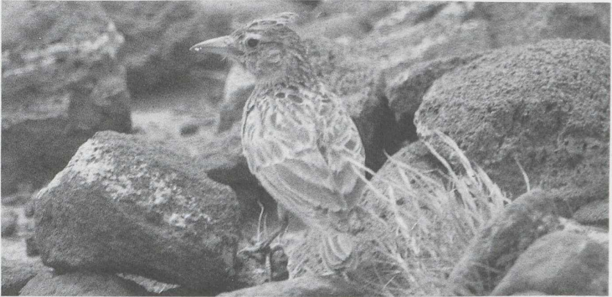
61-62 Razo Lark Alauda razae , male & female, Cape Verde Islands, March 1985 (A P van Harreveld).