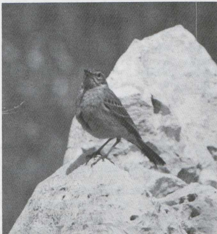
59-60 Langsnavelpieper Anthus similis , Israël, april 1984.

De Langsnavelpieper zou kunnen worden verward met de Duinpieper A campestris . De verschillen zijn samengevat in tabel 1. Wij vonden enkele verschillen die door Walsh & Wassink (1980) niet als zodanig werden beschouwd (maar wel in het redactionele naschrift), en vonden de wel door Walsh & Wassink genoemde verschillen moeilijker waarneembaar dan zij suggereren. De Langsnavelpiepers leken groter en dikbuikiger dan de in Israël voorkomende Duinpiepers. De snavel was lang en dik tot aan