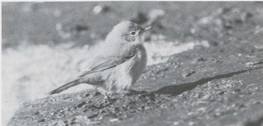
55 Brilgrasmus Sylvia conspicillata , IJmuiden, Noordholland, november 1984 (René van Rossum).

lichtbruin of, wanneer deze in de rui naar het eerste winterkleed is vernieuwd, voor een deel wit. Bij de meeste in Nederland verzamelde eerstejaars Grasmussen in het RMNH en ZMA was de buitenste pen lichtbruin.