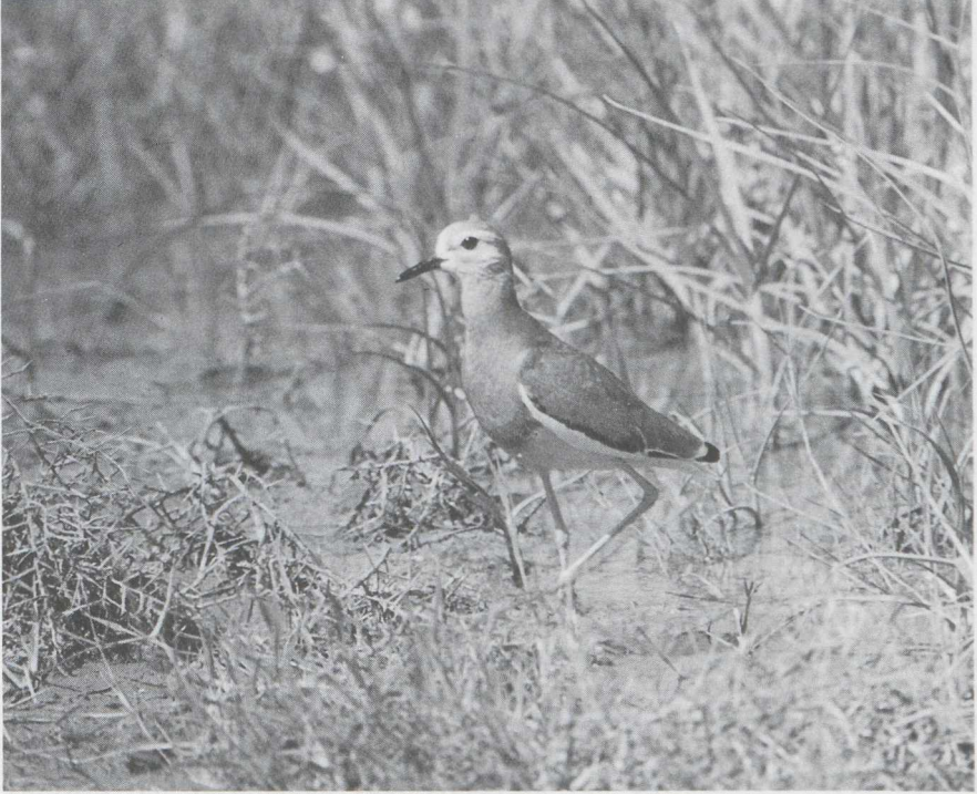
50 White-tailed Plover Chettusia leucura , Iraq, April 1965 (M von Tschirnhaus).

summer movements of Lapwings in Europe (Imboden 1974). Autumn migration of White-tailed does not start until August (Glutz von Blotzheim et al ). Unlike with Sociable Plover, the distribution of White-tailed records in Europe does not suggest any association with Lapwing movements (cf van den Berg 1984). White-tailed seems to associate much less with Lapwing than Sociable Plover, possibly due to different habitat preferences of the two species. In their regular range, some populations of White-tailed Plover are highly migratory and apparently somewhat nomadic which may be related to the exploitation of only temporarily flooded habitats.