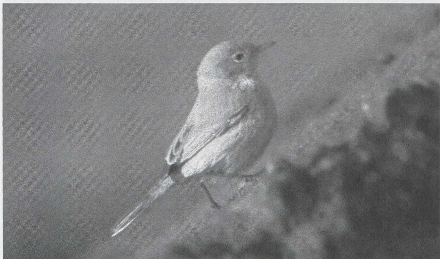
52 Brilgrasmus Sylvia conspicillata , IJmuiden, Noordholland, november 1984.

ONDERDELEN Lichtbruin, nauwelijks lichter dan bovendelen, scherp gescheiden van keel; zijborst en flank iets donkerder, buik en onderstaartdekveren iets lichter, zonder duidelijke overgangen.