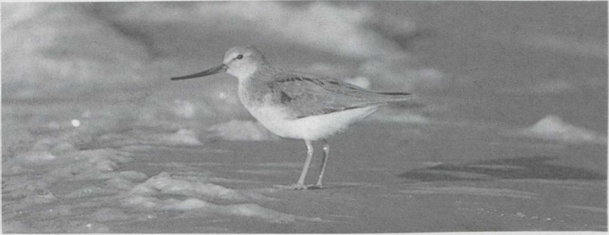
65 Terek Ruyter Xenus cinereus , Huizen, Noordholland, juni 1985 (Ger Blok).

28 mei zou in hetzelfde gebied ook een mannetje Kleinst Waterhoen P pusilla hebben geroepen. Op verschillende plaatsen werden in april en mei Kraanvogels Grus grus waargenomen. In de Oostvaardersplassen werd in mei enkele malen een Steltkluit Himantopus himantopus gezien. Grielen Burhinus oedichnemus verschenen te Vlaardingen Zh op 16 april en in de AW-duinen Nh op 21 april. Op de vlasakkers in Zuidelijk Flevoland waren in mei weer Morinelplevieren Charadrius morinellus te vinden; het hoogste aantal (43+) werd geteld op 19 mei. De Amerikaanse Gestreepte Strandloper Calidris melanotos lijkt een regelmatige verschijning te worden: er waren waarnemingen in