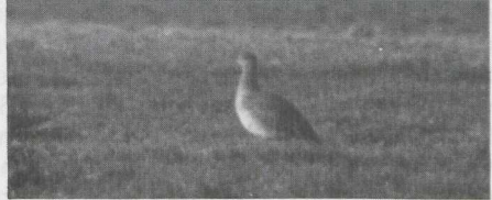
57-58 Kleine Trap Tetrax tetrax , Lage Zwaluwe, Noordbrabant, februari 1983 (Paul G Schrijvershof, Peter de Knijff).

veren wit. Overige dekveren bruin met zwarte en witte streepjes. Grote handdekveren zwart.