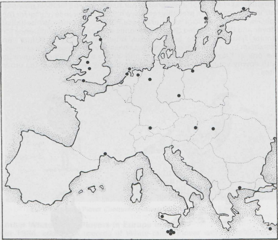
FIGURE 2 Distribution of White-tailed Plover Chettusia leucura records in Europe up to and including 1984.