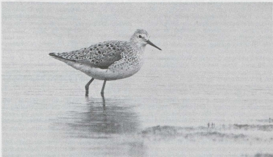
64 Poelruiter Tringa stagnatilis , Westzaan, Noordholland, mei 1985.

schijnlijk werden de jongen uitbroed in een knotwilg. Bijzonder waren ook de broedgevallen van twee paartjes Middelste Zaagbekken Mergus serrator in het Veerse Meer Z. Rosse Stekelstaarten Oxyura jamaicensis waren er te Kolhorn Nh en in Flevoland (twee) waar een mannetje gepaard was met een vrouwtje Tafeleend A ferina . In mei werd een dozijn Zwarte Wouwen Milvus migrans gemeld. Van 25 april tot 9 mei bevond zich een mannetje Steppekiekendief Circus macrourus op Schiermonnikoog Fr. Belangstellenden konden de spectaculaire baltsvluchten gadeslaan en zien hoe prooien werden overgedragen aan een vrouwtje Blauwe Kiekendief C cyaneus . Van een gemengd broedgeval is het echter toch niet gekomen. Op de Boschplaat van Terschelling overzomerde een Bastaardarend Aquila clanga ; de vogel arriveerde eind april en bleef tot in juni. Interessant is in dit verband de melding van een ongedetermineerde arend die op 24 april in noordwestelijke richting over Texel vloog. Op verschillende plaatsen werden in mei en juni Roodpootvalken Falco vespertinus gezien.