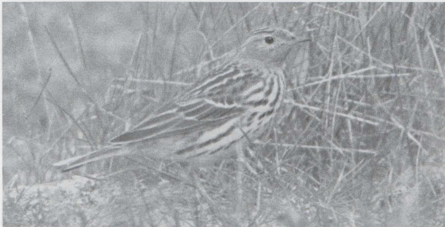
67 Roodkeelpieper Anthus cervinus , Maasvlakte, Zuidholland, mei 1985 (Pieter Bison).

UILEN TOT GORZEN De Oehoe Bubo bubo is een Nederlandse broedvogel geworden: in 1983 en 1984 werden in Limburg succesvolle broedgevallen vastgesteld. Onverwacht werd eind juni te Grolloo D een actief roepend mannetje Ruigpootuil Aegolius funereus ontdekt. De vogel werd gehoord van 20-26 juni. Een Alpengierzwaluw Apus melba vloog op 15 mei boven Knokke Wvl. Bijeneters Merops apiaster verschenen in de HW-duinen Zh (13 mei), te Reet A (23 mei), Knokke (24 mei), bij Antwerpen (26 mei: twee) en Deinze O (1 juni). De-