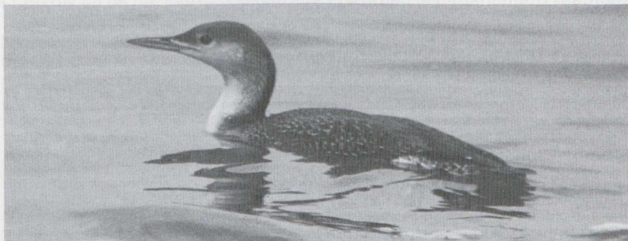
56 Red-throated Diver Gavia stellata in juvenile plumage, IJmuiden, Noordholland, January 1983 (Peter Scova Righini).

16 The long body, rounded head, unhooked and fairly long bill and white throat, foreneck and flank of the bird on mystery photograph 16 point straight to a diver Gavia . The photograph was obviously intended as an exercise following the article on divers in winter in the same issue ( DB 7: 40-49, 1985). The bird does not give an impression of being large, mainly due to the rather slim head and bill and surely it must be either a Red-throated Diver G stellata or a Black-throated Diver G arctica . Certain features seem indicative of the latter: the bill is straight and clearly not uptilted, the grey of the head darkens towards the lores and the rear part of the flank is showing as a white 'thigh' patch. So what can keep us from identifying it as a Black-throated and ageing it as a juvenile because of the pale streaks on upperparts and coverts?