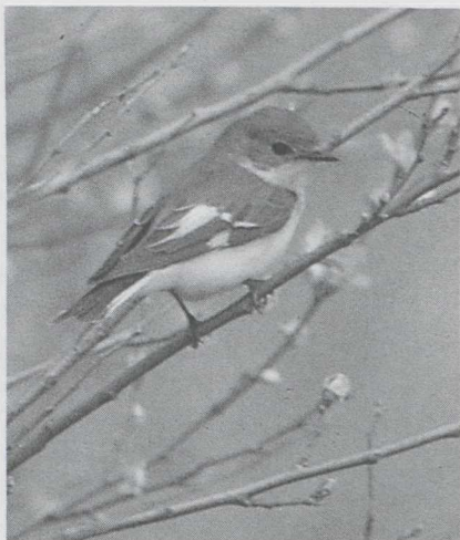
68 Withalsvliegenvanger Ficedula albicollis , vrouwtje, Maasvlakte, Zuidholland, mei 1985.

eerste Hop Upupa epops werd gezien te Loosdrecht U op 11 april; nadien volgde nog een 20-tal andere waarnemingen tot ver in mei. Te Brunssum L werd in juni weer enkele malen een Grijskopspecht Picus canus waargenomen; ditmaal betrof het echter een vrouwtje. Er werden vrij veel Roodkeelpiepers Anthus cervinus gemeld: te Lier (4 mei), op Schiermonnikoog (5 mei), de Maasvlakte (11, 13 en 17 mei), bij Antwerpen (11 mei: twee), Moeskroen Wvl (11-13 mei), op Vlieland Fr (12 mei), te Eemshaven Gr (17 mei), Ter Apel Gr (17 mei) en in de Lauwersmeer (18 mei). Roodgesterde Blauwborsten Luscinia svecica svecica verschenen op de Maasvlakte (12 mei: twee) en te Eemshaven (17 mei). Op Schiermonnikoog werd op 4 mei mogelijk een Rode Rotslijster Monticola saxatilis gezien en te Kalmthout op 17 mei mogelijk een Zwartkeellijster Turdus ruficollis . Vestigingspogingen van de Cetti's Zanger Cettia cetti lijken definitief voorbij. Slechts twee vogels werden waargenomen: te Blankenberge Wvl op 16 mei en te