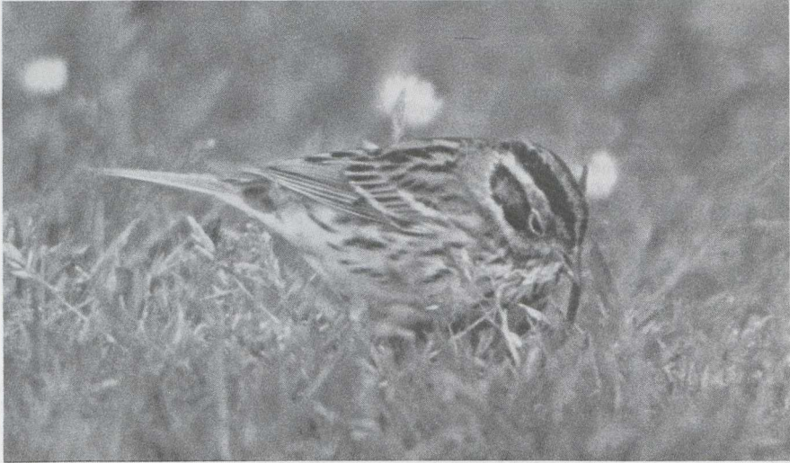
70 Dwerggors Emberiza pusilla , Terschelling, Friesland, mei 1985 (Pieter Bison).

Lombardsijde Wvl op 26 juni. Op 27 mei werd te Blankenberge een Orpheusspotvogel Hippolais polyglotta gevangen. Te Den Oever Nh verbleef op 10 juni een Grauwe Fitis Phylloscopus trochiloides ; de zanger liet zich nauwelijks zien maar zowel de zang als de roep konden worden opgenomen. Op 4 mei werd te Knokke een zingende Noordse Boszanger P borealis waargenomen. Op Schiermonnikoog zong van 15 tot 25 mei een Kleine Vliegenvanger Ficedula parva ; ook waren er waarnemingen te Vollenhove O (20 mei), Eemshaven (25 mei) en op de Maasvlakte (2 juni). Een vrouwtje Withalsvliegenvanger Falbicollis werd gevangen op de Maasvlakte op 10 mei; tot 12 mei liet de vogel zich daar observeren. Half mei werden in de Ooypolder zeven territoria ontdekt van Buidelmezen Remiz pendulinus . Er kon echter geen broedsucces worden vastgesteld; half juni waren alle nesten verlaten. Een succesvol broedgeval deed zich wel voor in Zuidelijk Fievoland alwaar op 9 juli uitgevlogen jongen werden waargenomen. Buidelmezen werden ook gemeld te Lier (28 april) en bij De Blocq van Kuffeler Fl (1 juni). Een Roodkopklauwier Lanius senator werd