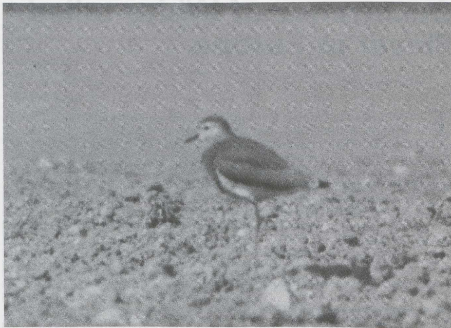
49 White-tailed Plover Chettusia leucura , GDR, May 1976 (K Hofmann).