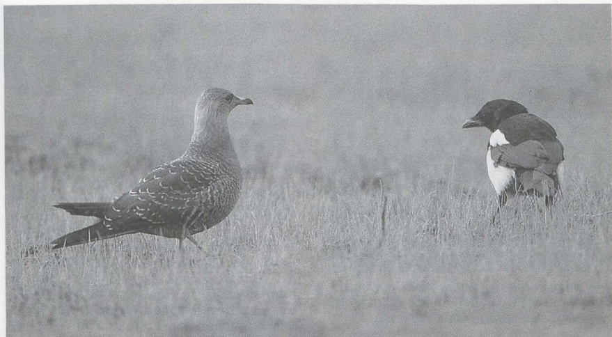
105 Kleinste Jager Stercorarius longicaudus en Ekster Pica pica , Wuustwezel, Antwerpen, september 1986 (Arie de Knijff)

Woestijneplevier Charadrius leschenaultii werd op 23 juli bij Zeebrugge ontdekt. Dit betekende het derde geval voor België. Rond 10 augustus waren er enkele Morinelplevieren C morinellus langs de Dodaarsweg Fl aanwezig. Op 4 september zaten er twee juvenielen te Kallo. Een leuke ontmoeting met deze soort had een bioloog in De Uithof U, die, op zijn knieën bezig in de proeftuin, opeens oog in oog met twee exemplaren zat. De enige Amerikaanse Gestreepte Strandloper Calidris melanotos werd op 31 augustus gemeld te Kallo. Op 23 september zou er een Siberische Gestreepte Strandloper C acuminata gefotografeerd zijn op Texel Nh. Een 'stint' Calidris , die van 9 tot 12 augustus langs de Oostvaardersdijk zat, liet in plaats van een sluitende determinatie grote onenigheid onder de aanwezige vogelaars achter. Een adulte Breedbekstrandloper Limicola falcinellus die op 20 en 21 juli in de Ooypolder Gld zat, was mogelijk al vanaf 6 juli aanwezig. Behalve de Blonde Ruiters Tryngites subruficollis die op 4 juli bij Kallo zat, was er in België nog een geval in Het Zwin van 27 tot 30 juli. Vele 10-tallen vogelaars in Nederland waren daarom dolblij dat er van 16 tot 19 augustus één te bewonderen viel op een onder water gezet bollenveld bij Lisse Zh.