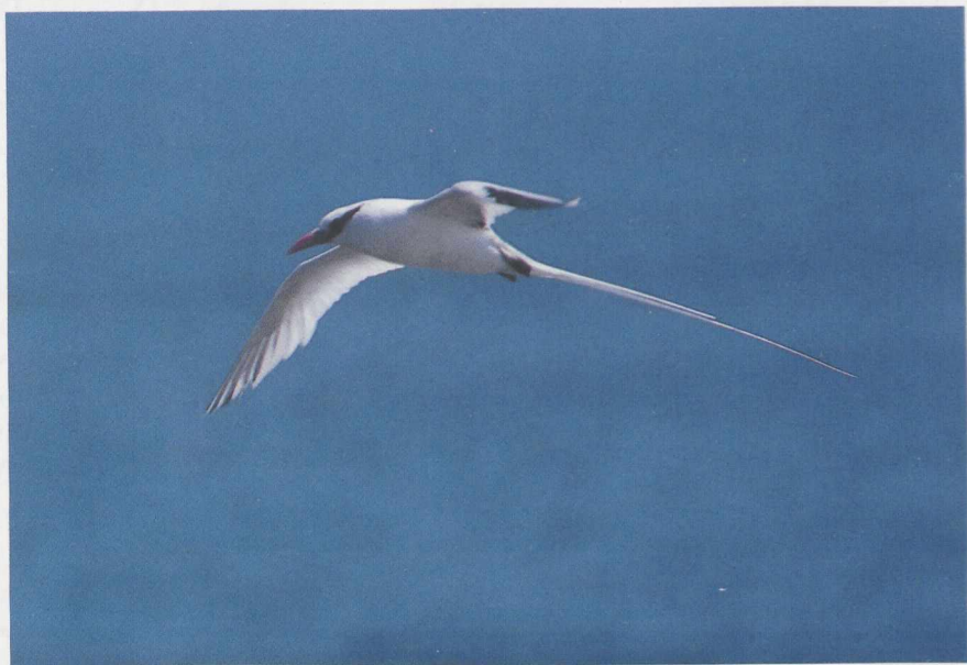
89 Red-billed Tropicbird Phaethon aethereus , and 90 Brown Booby Sula leucogaster , Razo, Cape Verde Islands, March 1986