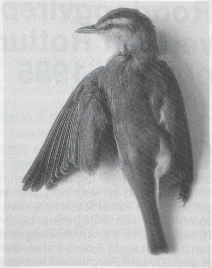
80 Rodoogvireo Vireo olivaceus , Alme-re, Flevoland, oktober 1985, dood gevonden te Wormerveer, Noordholland (Karel A Mauer)

NAAKTE DELEN Iris donkerbruin. Bovensnavel grijszwart met zeer smalle vleeskleurige snijrand, ondersnavel vleeskleurig, in