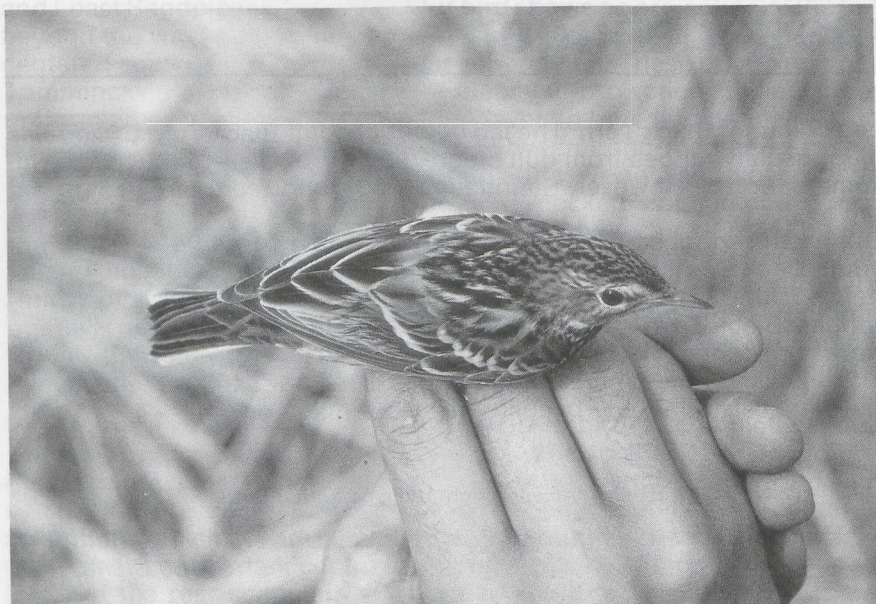
99-100 Pechora Pipit Anthus gustavi , Taiwan, October 1982 (Urban Olsson)