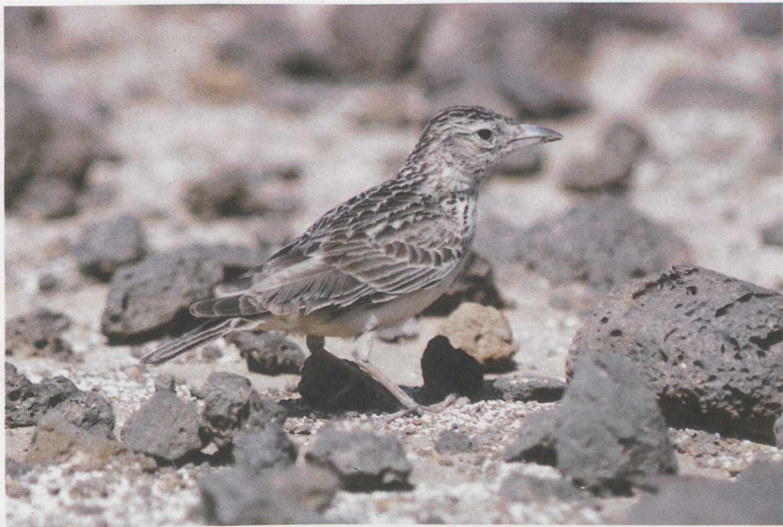
94-95 Razo Lark Alauda razae , male & female, Razo, Cape Verde Islands, March 1986