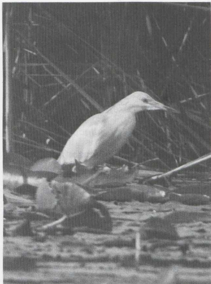
83 Squacco Heron Ardeola ralloides , Alblasserdam, Zuidholland, July 1984 84 Lesser Spotted Eagle Aquila pomarina , Katwijk, Zuidholland, November 1984