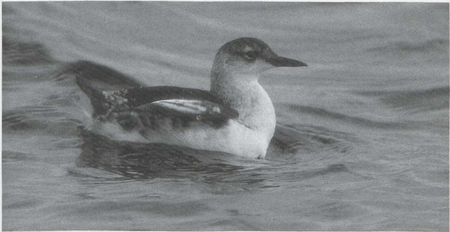
32 Zwarte Zeekoet Cephus grylle , Brouwersdam, Zuidholland, december 1985 (Guus Hak).

werd te Blokkersdijk een Bastaardarend Aquila clanga gemeld. Roodpootvalken Falco vespertinus werden gezien op 6 oktober op het Muiderzand FI, op 13 oktober te Sint Kruis-Winkel Ovl, een adult mannetje op de Maasvlakte op 14 oktober, in de tweede decade van oktober in het Bargerveen D (drie) en te Merksplas A op 23 oktober. Ook dit najaar werden er weer veel Slechtvalken F peregrinus gemeld. Zo zouden er maximaal zes in het Lauwersmeergebied hebben gezeten en waren er eind december drie bij Kallo-Doel A.