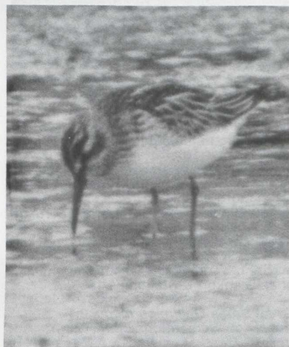
4 Broad-billed Sandpiper Limicola falcinellus , Serooskerke, Zeeland, August 1983 (Arnoud B van den Berg).

NOORDHOLLAND Texel, 7 August (G Armbruster).