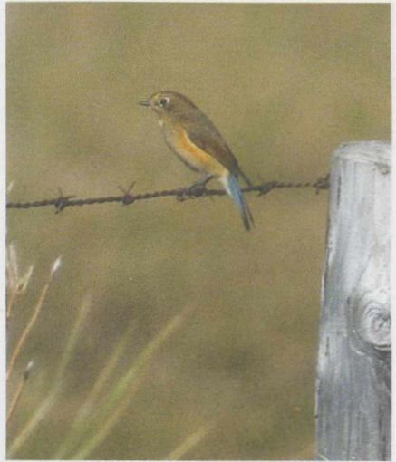
18 Woestijnplevier Charadrius leschenaultii , Terschelling, Friesland, augustus 1984. 19 Blauwstaart Tarsiger cyanurus , Texel, Noordholland, september 1985. 20 Citroenkwikstaart Motacilla citreola , Castricum, Noordholland, september 1984.