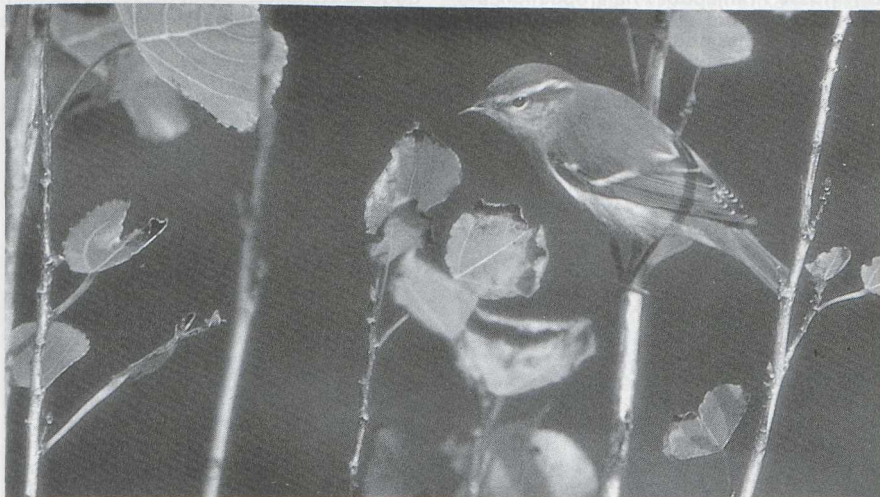
36 Bladkoninkje Phylloscopus inornatus , Maasvlakte, Zuidholland, oktober 1985.

Langsvliegende Roodstuitzwaluwen Hirundo daurica werden gezien bij Katwijk Zh op 20 oktober en bij Maarn U op 23 oktober. In oktober kwamen 22 meldingen van Grote Piepers Anthus novaeseelandiae binnen. Eveneens in oktober werden op zes plaatsen Roodkeelpiepers A cervinus gezien. Een Gele Kwikstaart Motacilla flava te Medemblik Nh op 19 november was laat. De eerste Pestvogel Bombycilla garrulus werd op 10 oktober gezien bij Rossum O. In november waren er meldingen te Oudega Fr en Hengelo O (twee). Rond de jaarwisseling verbleven er enkele op Schiermonnikoog Fr. Waterspreeuwen Cinclus cinclus waren aanwezig te Wor-