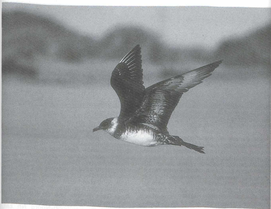
29-30 Middelste Jagers Stercorarius pomarinus , Maasvlakte, Zuidholland, november 1985 (René Pop, Hans Gebuis).