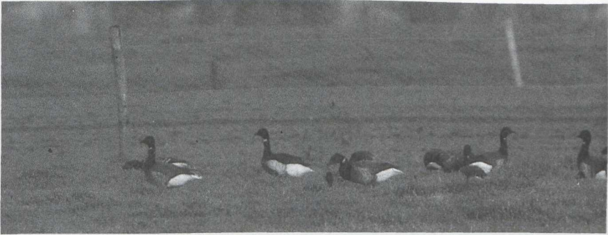
28 Rotganzen Branta bernicla bernicla en Zwartbuikrotgans B b nigricans , Hippolytus-hoef, Noordholland, november 1985 (Arnoud B van den Berg).