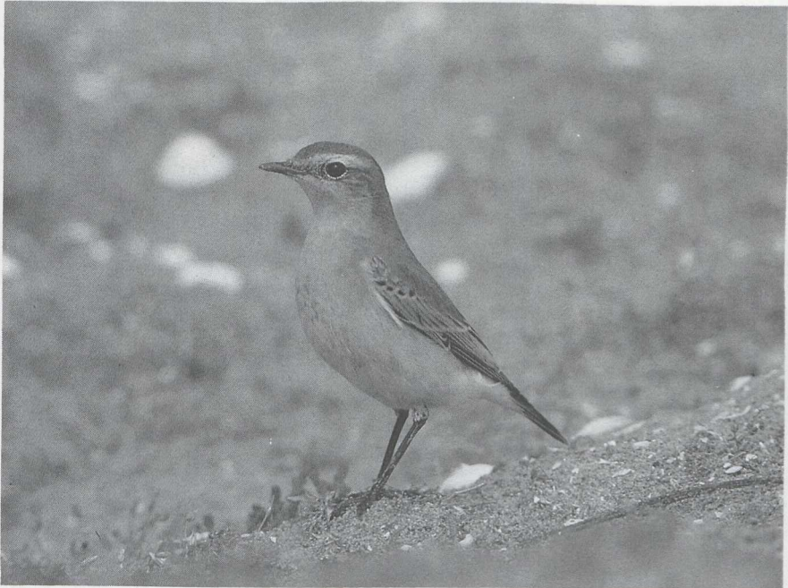
11 Wheatear Oenanthe oenanthe , Maasvlakte, Zuidholland, August 1984 (Arie de Knijff).

wings and the upperparts of Isabelline. Since the mystery photograph was taken in April, the wing pattern should rule out Wheatear. In fresh winter plumage when Wheatear shows fairly wide pale fringes to coverts and remiges, the difference is much less than in spring. In Wheatear the centres of coverts and remiges are, however, considerably darker with more clear-cut and slightly narrower fringes. This is usually obvious on median and at least some greater coverts (on those on which parts of the dark centres are exposed). Thus, the dark alula does usually not stand out as in Isabelline. In Wheatear in fresh plumage, the breast is normally fairly rich rufous-buff, contrasting with paler belly; the throat is usually slightly paler than the breast. In Isabelline the underparts are generally paler and more uniformly buffish, frequently with a paler throat and short submoustachial stripes. Differences in underparts are, however, often very slight. The dark terminal bar of the tail is noticeably wider in Isabelline. The underwing is much paler in Isabelline due to the whitish axillaries, underwing-coverts and edges to the remiges. Wheatear has dark axillaries and underwing-coverts with rather broad pale fringes. So, the mystery bird is an Isabelline Wheatear, photographed by Edward van IJzendoorn in Israel in April 1984.