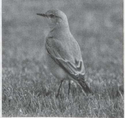
8-9 Isabelline Wheatear Oenanthe isabellina , Israel, April 1984.