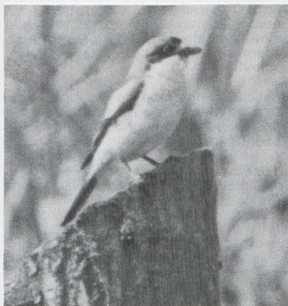
6 Woodchat Shrike Lanius senator , Knardijk, Flevoland, June 1983 (Arnoud B van den Berg).