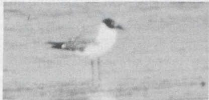
44 Laughing Gull Larus atricilla , Greece, August 1984.

secondaries. Underparts and tail white. BARE PARTS Bill blackish though basal third blackish-red. Leg blackish.