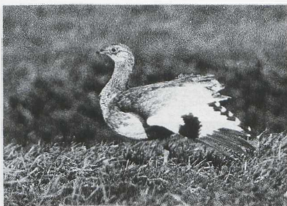
52 Kleine Trap Tetrao tetrao , Nijkerk, Gelderland, januari 1986 (Guus Hak).

KRAANVOGELS TOT ALKEN Bij Saeftinge bevond zich tot 29 januari een adulte Kraanvogel Grus grus . Op 15 en 16 januari verbleef een onvolwassen vogel bij Har-chies. Tussen 14 en 17 maart was er een