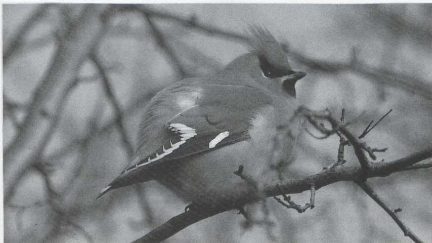
55 Pestvogel Bombycilla garrulus , adult, Wijk bij Duurstede, Utrecht, februari 1986 (René Pop).

januari waren er maximaal vier te Almere, op 16 januari één bij Driebergen U, op 19 januari twee te Kontich A, op 25 januari één bij Rilland Z, op 26 januari c 24 bij Hijker-Smilde D, de eerste twee weken van februari maximaal 10 bij Wijk bij Duurstede U, van 9 tot 27 februari drie bij Vorst B, in de tweede week van februari c 16 te Groningen Gr, op 18 februari drie en op 22 februari acht te Enschede O, op 21 februari enkele te Huizen Nh, op 26 februari twee te Schagen Nh en in de derde week van februari drie bij Kortrijk. De Waterspreeuw Cinclus cinclus van Wageningen Gld zat daar tot zeker 24 januari. Eind december werd enkele keren een exemplaar gezien langs de Dinkel nabij Denekamp O. Op 7 februari zat er één in Sonsbeek te Arnhem Gld, op 23 februari één te Groningen en op 26 februari één bij Diepenheim O. Het in oktober 1985 in Zuidelijk Flevoland gevangen vrouwtje Kleine Zwartkop Sylvia melanocephala (DB 8: 39, 1986) bleek na bestudering van het fotomateriaal een Cinereus Warbling-Finch Poospiza cine-