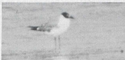
44 Laughing Gull Larus atricilla , Greece, August 1984 (Per Ole Syvertsen).

secondaries. Underparts and tail white. BARE PARTS Bill blackish though basal third blackish-red. Leg blackish.