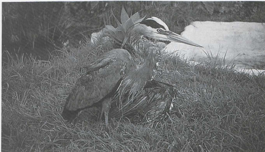
41 Great Blue Heron Ardea herodias , Azores, April 1984 (Fátima Le Grand).

c 10 Great Blue Herons were observed on the Azorean islands of São Miguel, Pico and Faial. They had lost all sense of fear and seemed exhausted. One had paint on its back which analysis proved to be anti-rust red-lead paint. It was stuck all over its back and secondaries and prevented it from flying any great distance. Three other birds (two on São Miguel, one on Faial) had machine grease sticking to their feet. It is assumed, therefore, that these birds' passage to the Azores had been ship-assisted. Enquiries at the vessels moored in the three main ports in the Azores yielded no new information. On dissection, the three specimens proved to be adults completely lacking fat deposits. The measurements given in table 1 would suggest that these birds belong to the migratory subspecies A h herodias from north-eastern North America which migrates to Central and northern South America (cf Palmer 1962).