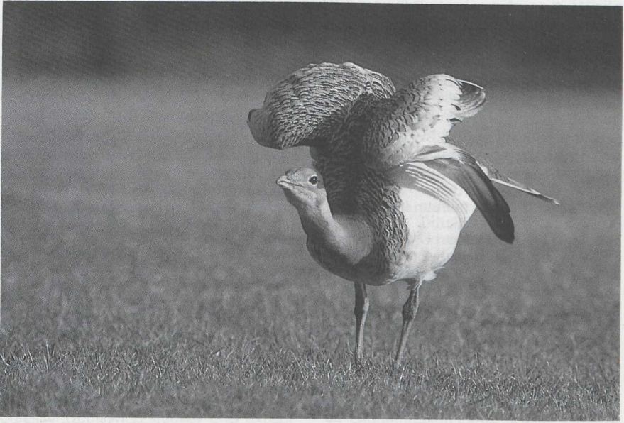
42-43 Grote Trap Otis tarda , Teuge, Gelderland, januari 1985.