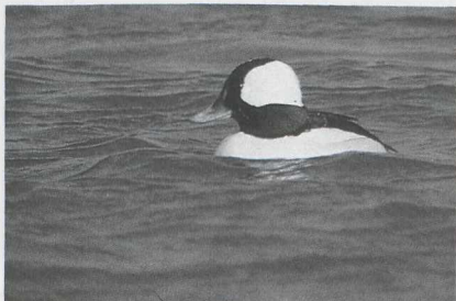
49 Witoogeend Aythya nyroca , Overveen, Noordholland, februari 1986. 50 Buffelkopeend Bucephala albeola , Cuijk, Noordbrabant, februari 1986.

mannetje Buffelkopeend Bucephala albeola van 18 februari tot 1 maart en op 30 maart te Cuijk Nb. Nog een Buffelkop werd op 27 maart te Lommel BL opgemerkt waar hij tot 29 maart bleef. Op 7 en 8 april werd waarschijnlijk dezelfde vogel bij Geel