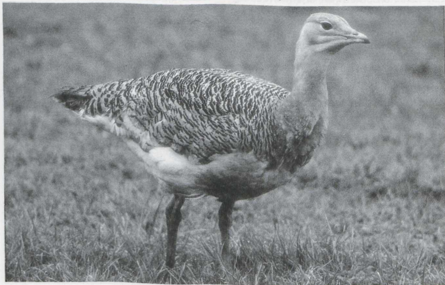
53 Grote Trap Otis tarda , Beltrum, Gelderland, januari 1986 (Paul Knolle).

trekgolf over België met op 16 maart meer dan 2500 vogels bij Torgny Lx. Het mannetje Kleine Trap Tetrax tetrax dat op 18 januari langs het Nulderpad bij Zeewolde Fl werd ontdekt, verscheen op de volgende dag in de Polder Arkemheen bij Nijkerk Gld en werd daar op 20 januari voor het laatst gezien. Dit was de tweede waarneming van deze soort in Nederland sinds 1959. Vanaf 9 januari tot ver in februari verbleef een eerste winter mannetje Grote Trap Otis tarda bij Beltrum Gld.