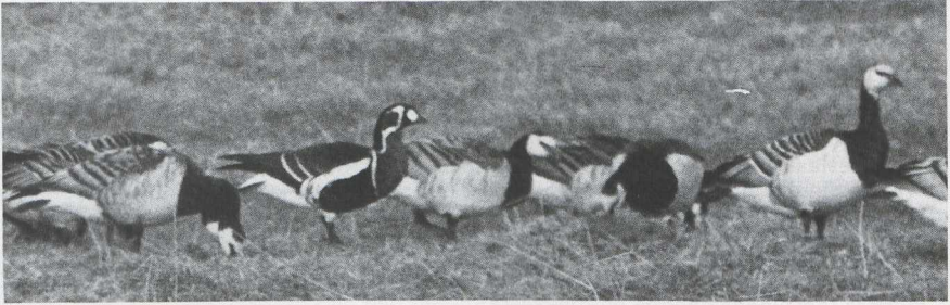
48 Roodhalsgans Branta ruficollis en Brandganzen B leucopsis , Voorne, Zuidholland, februari 1986 (Hans Gebuis).