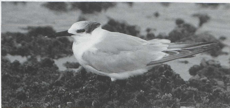
54 Grote Stern Sterna sandvicensis in adult winterkleed, Brouwersdam, Zuidholland, januari 1986 (René Pop).

Er werden twee Middelste Jagers Stercorarius pomarinus gemeld: een adult op 4 januari bij Stellendam en één op 11 en 12 januari te Eemshaven Gr. Een Reuzenzwartkopmeeuw Larus ichthyaetus werd op 2 februari gemeld bij Workum Fr. Zwartkopmeeuwen L. melanocephalus werden gezien op 21 januari bij Ritthem Z (twee) en op 6 februari op de Maasvlakte (twee adulten). Ook in België waren er meerdere waarnemingen van Zwartkopmeeuwen. Op 8 en 16 januari bevond zich een Geelpootmeeuw L. cachinnans bij Harelbeke, op 11 januari één bij Lelystadhaven Fl en op 10 februari een adult te Duffel. De enige Kleine Burgemeester L. glaucoides uit de periode werd dicht bij de Belgische kust achter de veerboot Dover-Zeebrugge gezien in de eerste week van januari. In de gehele periode waren er maximaal drie Grote Burgemeesters L. hyperboreus te IJmuiden (waaronder één in tweede zomerkleed). Bij Oostende Wvl werden maximaal twee Grote Burgemeesters gezien en te Brugge Wvl werd op 9 februari een exemplaar in eerste winterkleed waargenomen. Adulte vogels waren er bij de Brouwersdam tot 8 februari en te Kornwerderzand Fr tot 2 maart. Verspreid langs de kust werden nog enkele exemplaren gezien en op 11 januari was er één te Lelystadhaven. Op 25 januari werden op het noordelijk deel van het IJsselmeer bij Den Oever Nh ruim 700 foeragerende