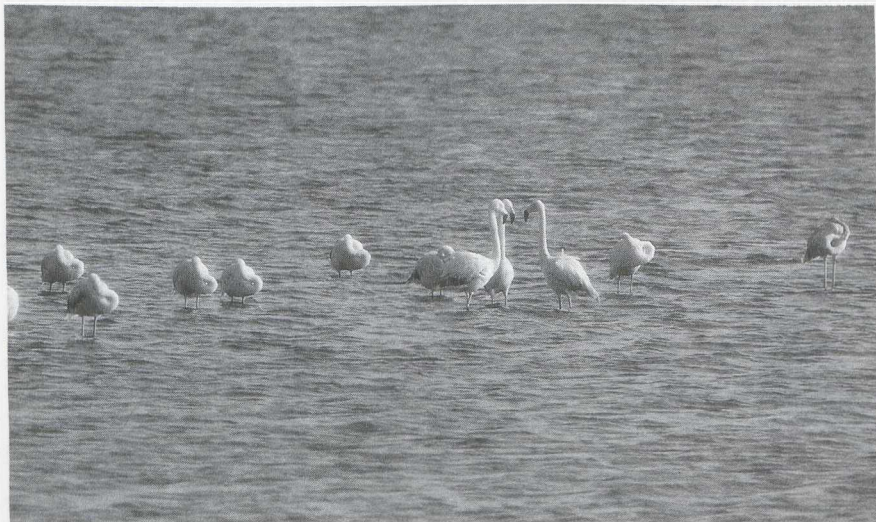
2 Chileense Flamingo's Phoenicopterus chilensis en één Caraïbische Flamingo P. ruber ruber (rechts), Herkingen, Zuidholland, oktober 1982 (Paul Knolle)

verspreidingsgebied van deze soort en het voorkomen in Europa (twee gevallen in Spanje in 1966 en 1972) is het waarschijnlijk dat het evenals de Caraïbische en Chileense Flamingo's een vogel uit gevangenschap betrof. De soort wordt minder in gevangenschap gehouden dan de Euraziatische/ Caraïbische en de Chileense Flamingo hoewel het verreweg de talrijkste flamingosoort ter wereld is (Kear & Duplaix-Hall).