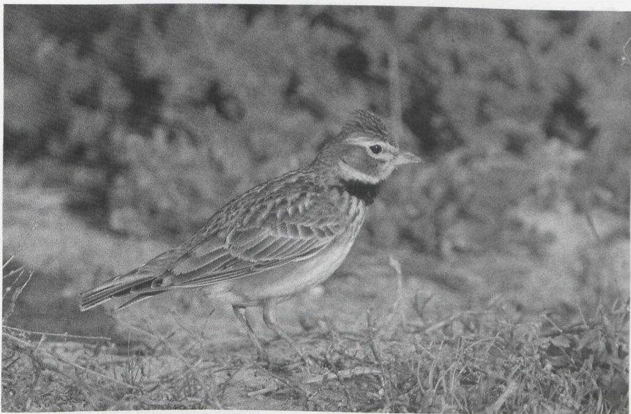
105 Calandra Lark Melanocorypha calandra , Turkey, April 1987 106 Bimaculated Lark M bimaculata , Turkey, May 1987 (Arnoud B van den Berg)