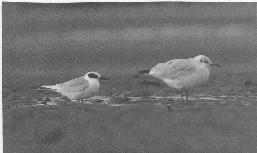
100 Forsters Stern Sterna forsteri en Kokmeeuw Larus ridibundus , Ritthem, Zeeland, november 1986

De volgende ochtend waren de meest enthousiaste vogelaars uit Nederland en België al een uur voor zonsopgang bij de Sloehaven aanwezig. Om 7:30 werd de Forsters Stern vliegend boven de Westerschelde en de Sloehaven gezien. Hij werd hier en op een nabijgelegen strand de gehele dag waargenomen. 's Middags kreeg hij enige tijd gezelschap van een Grote Stern S sandvicensis . Enkele 100en vogelaars kwamen hem bekijken. De volgende dagen werd de vogel niet meer teruggezien.