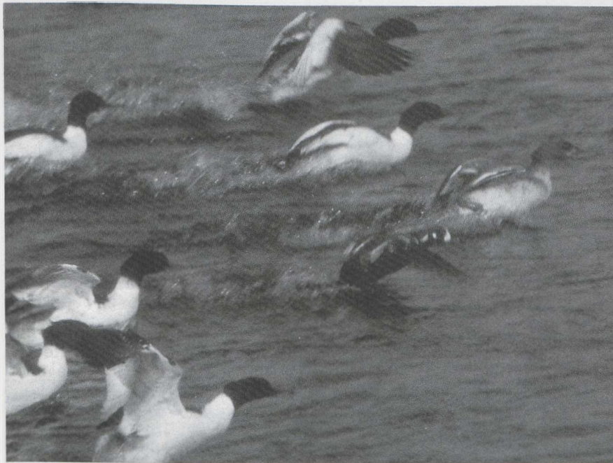
11 Harlequin Duck Histrionicus histrionicus and Goosanders Mergus merganser, Norway, June 1986