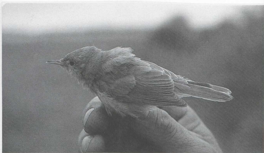
29 Kleine Spotvogel Hippolais caligata , Almere, Flevoland, oktober 1986

IJSVOGELS TOT GORZEN Op 4 oktober werd er één Hop Upupa epops gezien bij Kijkduin Zh en twee bij Scheveningen. Op 14 en 15 oktober zat er één bij Lossers O en op 15 oktober ook één bij Heemskerk Nh. Van begin oktober tot begin november was er veel doortrek van Strandleeuweriken Eremophila alpestris . Grote Piepers Anthus richardi werden gemeld begin oktober bij Maarn, van 4 tot 13 oktober op de Maasvlakte, op 5 oktober bij Uitbergen Ovl, op 11 oktober op Texel, op 14 oktober bij Wuustwezel A, op 17 oktober bij Castricum, op 18 en 30 oktober bij Katwijk, op 18 oktober bij Zalk O (twee), op 29 oktober bij Den Oever Nh en op 9 november bij Kijkduin. De laatste Duinpieper A campestris werd op 27 oktober in De Kennemerdunnen gemeld. Roodkeelpiepers A cervinus waren er van 1 tot 3 oktober in de Eemshaven Gr, begin oktober één (vangst) bij Niel A en enkele bij Lokeren Ovl en op 5 oktober één (vangst) bij Uitbergen. Vanaf 14 december werden weer op diverse plaatsen kleine aantallen Pestvogels Bombycilla garrulus gezien. Op 29 en 30 oktober zat er een Waterspreuw Cinclus cinclus bij Katwijk, op 8 november één bij Middelburg Z en op 12 en 13 november één bij Zevenhuizen Zh. De eerste Perzische Roodborst Irania gutturalis voor Nederland, die op 3 en 4 november te Maasland Zh zat, zorgde kort na de Forsters