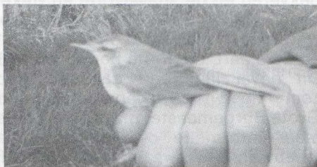
16 Veldrietzanger Acrocephalus agricola , Makkum, Friesland, oktober 1982

Veldrietzanger ook al in oktober 1982 te Makkum Op 23 oktober 1982 werd op de Makkumer Zuidwaard te Makkum Fr door de Ringgroep Menork een karekiet Acrocephalus -achtige gevangen die niet op naam kon worden gebracht. De vogel werd om 11:30 aangetroffen in een mistnet in een rietstrook langs het water. Hij werd gefotografeerd en gefilmd in aanwezigheid van Willem Bil, Auke de Vries en J A de Vries (ringer). Omdat hij niet kon worden gedetermineerd werd de vogel ongeringd vrijgelaten.