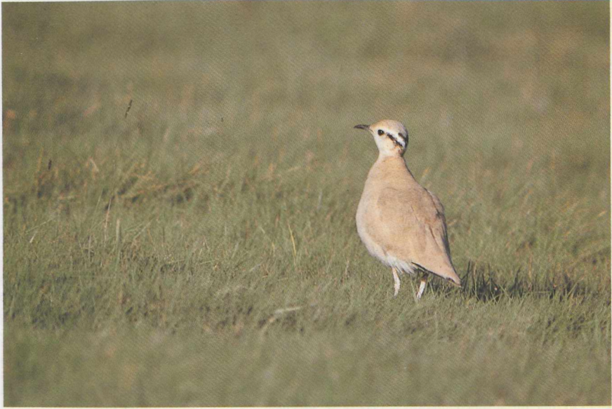
22 Renvogel Cursorius cursor , Texel, Noordholland, oktober 1986 23 Perzische Roodborst Irania gutturalis , Maasland, Zuidholland, november 1986