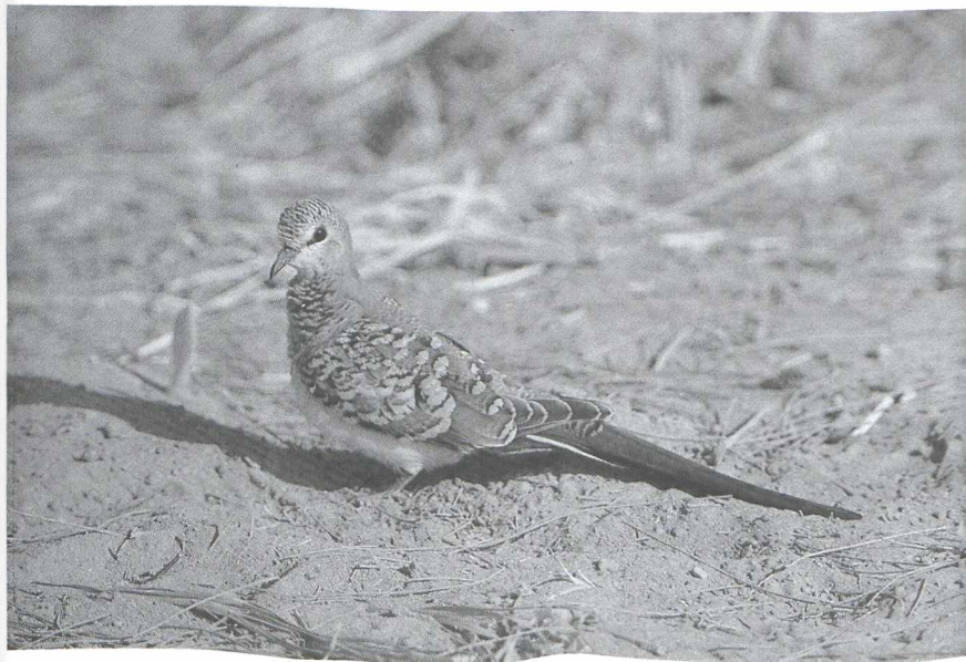
19 Namaqua Dove, juvenile, Israel, November 1986