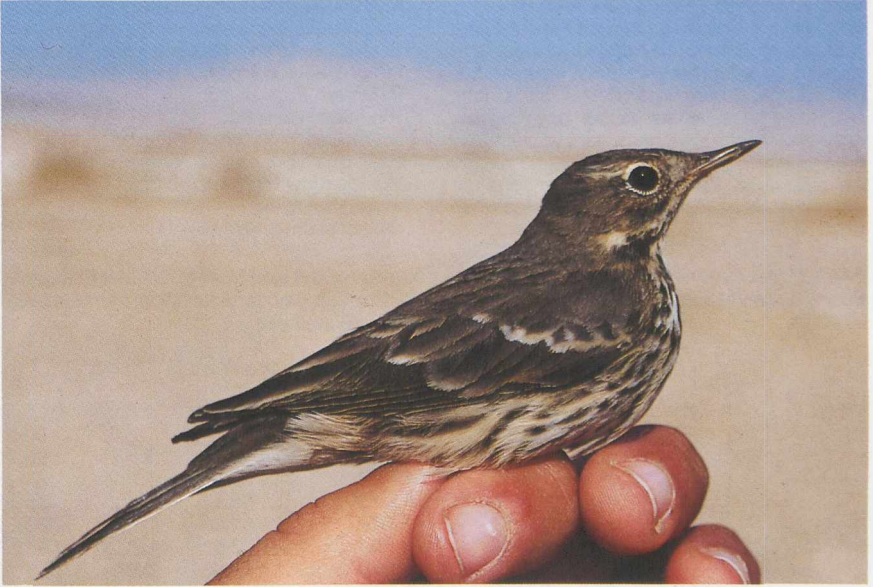
3-4 Siberian Water Pipit Anthus rubescens japonicus , Israel, November 1985