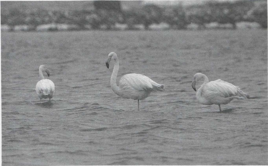
1 Euraziatische Flamingo's Phoenicopterus ruber roseus , Oostvoornse Meer, Zuidholland, februari 1985 (Arnoud B van den Berg)

gen in te zenden, werden voor de periode 1975-84 c 100 gevallen ontvangen van in totaal c 600 vogels.