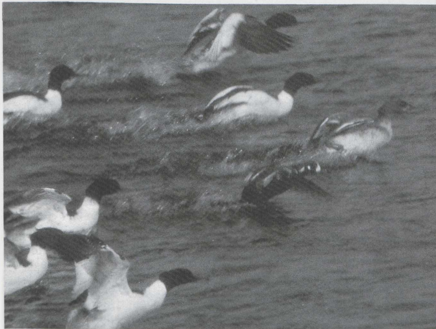
11 Harlequin Duck Histrionicus histrionicus and Goosanders Mergus merganser, Norway, June 1986