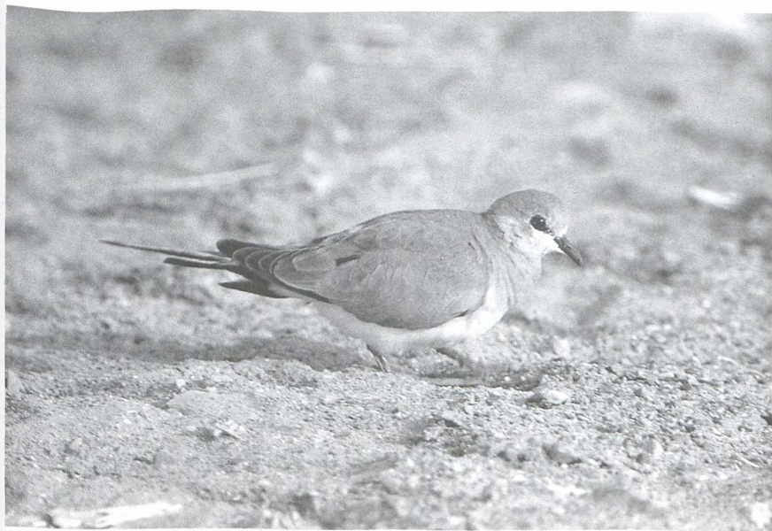
18 Namaqua Dove Oena capensis , female, Israel, April 1984 (Edward J van IJzendoorn)