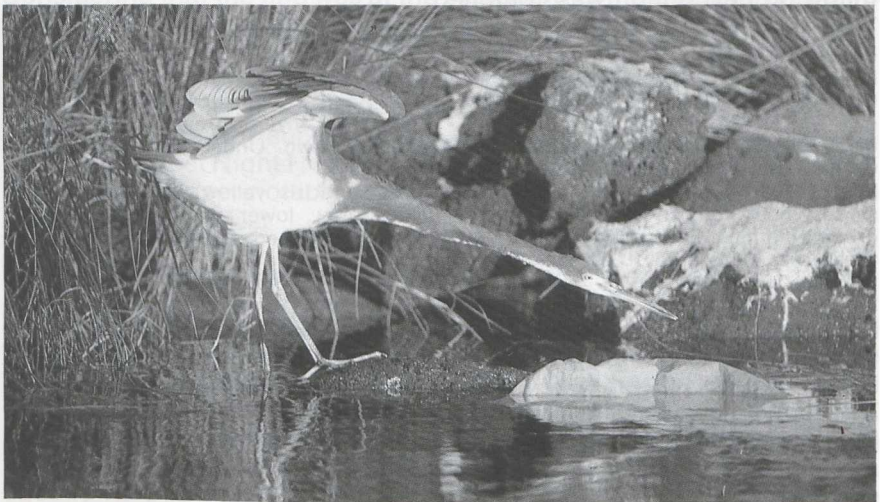
9 Tricolored Heron Egretta tricolor , Azores, October 1985

Situated in mid-Atlantic, the Azores archipelago is well-placed to receive landfalls of American migrants. Apart from Ring-billed Gull Larus delawarensis , which winters regularly in the Azores, there have been some 150 records of about 40 Nearctic species (le Grand 1983). This list includes very few passerines, but is otherwise broadly representative of the American migrants which reach Europe. Only three species recorded on the Azores have yet to be observed elsewhere in the western Palearctic: Little Blue Heron E caerulea , one ringed bird