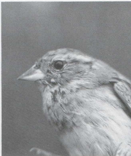
32 Roodmus Carpodacus erythrinus , Koog aan de Zaan, Noordholland, november 1986 (Guus Hak) 33 Maskergors Emberiza spodocephala , Westenschouwen, Zeeland, november 1986 (Aad Vuyk)

november was er een invasie van Grote Barmsijzen Carduelis flammea flammea met op 7 november 2500 en op 13 november 1500 te Katwijk en op 12 en 13 november 5500 bij Kijkduin. De volgende vangsten van Witsuitbarmsijzen C. hornemanni werden ons gemeld: begin november AW-duinen Nh, Leuven B, Aalst Ovl en Schelle A en op 14 en 23 november en 10 december bij Tongeren O. Begin augustus werden er aan de kust van België al verschillende Witbandkruisbekken Loxia leucoptera gevangen. Op 27 september en 3 oktober werd op Vlieland dezelfde Roodmus Carpodacus erythrinus gevangen. Van 15 tot 17 november zat er een vrouwtje bij Koog aan de Zaan Nh. Van 6 tot 8 november werd bij Vijfhuizen Nh een mannetje Mexicaanse Roodmus C. mexicanus gezien. Op 18 oktober werd op Texel een Bosgors Emberiza rustica gemeld. Dwerggorzen E. pusilla waren er op 23 september op Vlieland (vangst), op 16 en 17 oktober op Texel, op 27 oktober bij Katwijk, op 9 november bij Kijkduin en op 12 november bij Castri-