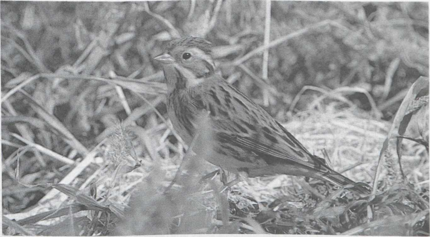
21 Bosgors Emberiza rustica , Israel, november 1986 (Arnoud B van den Berg)