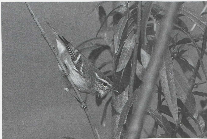
30 Bladkoninkje Phylloscopus inornatus , Maasvlakte, Zuidholland, oktober 1986