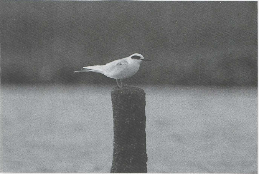
27 Forsters Stern Sterna forsteri , Ritthem, Zeeland, november 1986 ( René Pop ) 28 Goudlijster Zoothera dauma , Katwijk, Zuidholland, oktober 1986 ( Arie de Knijff )