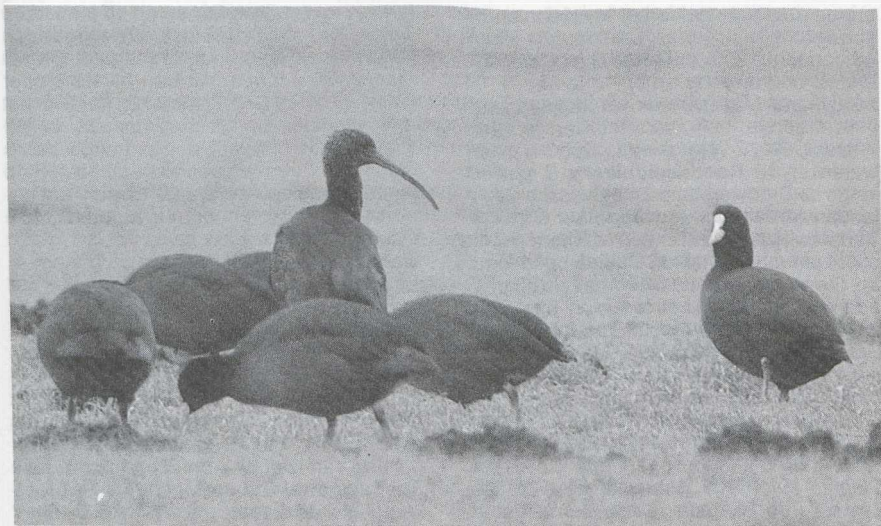
54 Zwarte Ibis Plegadis falcinellus en Meerkoeten Fulica atra , Camperduin, Noordholland, januari 1987

half januari werden er weer vele 10-tallen Witbuikrotganzen B bernicla hrota gezien, voornamelijk rond de Grevelingen Z met groepen tot 50 exemplaren. Zwartbuikrotganzen B b nigricans werden gezien bij Westkapelle van 17 tot 20 januari, bij de Flaauwers Inlagen Z op 7 februari en bij Wolphaartsdijk Z op 5 en 6 maart. Bij Zandvliet A zaten op 4 januari nog steeds twee Roodhalsganzen B ruficollis . Bij Spijkenisse zaten er twee van 3 tot 31 januari. Enkelingen waren er te Meetkerke van 3 tot 7 januari, te Vlissegem Wvl op 10 januari en bij Damme op 15 januari. Op 29 maart zat er een mannetje Amerikaanse Smient Anas americana bij het Jaap Deensgat in de Lauwersmeer Gr. Witog-eenden Aythya nyroca werden gemeld bij Brugge Wvl van 24 december tot 19 januari, bij Meer A op 8 januari, op het Amstelmeer Nh op 11 januari (twee), in de Dintelhaven Zh op 31 januari, bij Galder Nb op 22 februari, in De Kennemerduinen Nh op 14 maart en bij Eke van 16 tot 18 maart. De determinatie van een vrouwtje Koningseider Somateria spectabilis dat op 20 januari te IJmuiden Nh gefotografeerd werd leidde niet tot een eensluidend oordeel. Veel vogelaars zullen