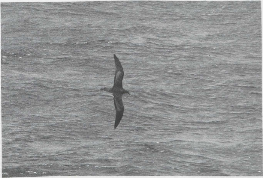
51-52 Jouanin's Petrel Bulweria fallax , Arabian Sea, July 1985 (Arnoud B van den Berg)