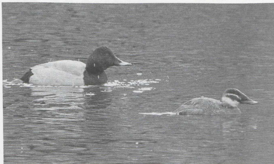
55 Witkopeend Oxyura leucocephala en Tafeleend Aythya ferina , Utrecht, Utrecht, februari 1987

eerder: behalve een overwinteringsgeval in het Verdronken Land van Saeftinge Z kwamen al vanaf half januari de eerste meldingen binnen. Tot eind maart waren dit er minstens 14 in Nederland en België. De onvolwassen Zeearend Haliaeetus albicilla , die tussen Kalmthout A en het Verdronken Land van Saeftinge verbleef, werd daar nog tot 10 januari gezien. Verder was er op 4 januari een onvolwassen Zeearend bij het Ketelmeer FI, op 10 januari een adult in de achterhaven van Zeebrugge, begin januari een onvolwassen bij Gaast Fr, op 17 en 18 januari een onvolwassen bij Oud-Beets Fr en de gehele periode — in ieder geval tot 8 maart — zeker twee en wellicht drie in de Biesbosch Nb. De grootste kilometervreter van dit seizoen was wel de Giervalk Falco rusticolus die van 7 februari tot half maart regelmatig in en om de Eemshaven Gr werd gesignaleerd en daar ook in april weer enkele malen opdook. Bij Beegden L werd op 1 februari een Slechtvalk F peregrinus gezien met kenmerken van de ondersoort F p calidus . Gedurende de winter werden van veel plaatsen Slechtvalken gemeld. Bij Goedereede liet zich er een bij uitzondering eens van dichtbij fotograferen.