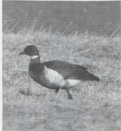
59 Zwartbuikrotgans Branta bernicla nigricans , Flauwers Inlagen, Zeeland, februari 1987 (Arie de Knijff)

STEPPEHOENDERS TOT GORZEN Op 4 maart was er een claim van twee Steppehoenders Syrnhaptes paradoxus bij de Braakman Z die helaas niet nader bevestigd kon worden. Tot midden januari deed een Tortel Streptopelia turtur een poging tot overwinteren bij Westenschouwen Z. In de Boswachterij Grollo D werden in maart twee Ruigpootuilen Aegolius funereus gehoord. Bepaald vroeg was een Gierzwaluw Apus apus die op 27 maart op de Maasvlakte dood gevonden werd. Tot in februari waren er op veel plaatsen — vooral in het binnenland — nog groepen Strandleeuweriken Eremophila alpestris present. Zo waren er vele 10-tallen in de Eemshaven, langs de randmeren van de Flevo en langs de Ooster- en Westerschelde. Er was een troep van c 200 bij Eibergen Gld. Vele 100-en — zo niet 1000-en — zouden er in Noordbrabant hebben gezeten. In België waren er groepen