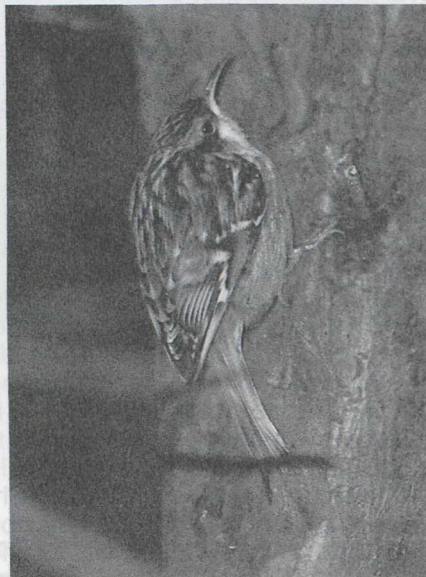
46 Tree creeper Certhia familiaris , Wieringerwerf, Noordholland, January 1987 47 Short-toed Tree creeper C brachydactyla , Alphen aan den Rijn, Zuidholland, February 1987

23 Mystery photograph 23 obviously shows a tree creeper Certhia . The two species occurring in the western Palearctic are difficult to separate, the more so from photographs, when their characteristic calls can not be heard. The problem is made even more complicated by the geographical variation in plumage that one of them, the Tree creeper C familiaris , shows in Europe. Still, a correct identification should be possible from a good photograph like the one shown here. Useful differences between the two species can be found in the coloration of upperparts and underparts, the prominence of the supercilium and to a lesser extent in the length of hind claw and bill.