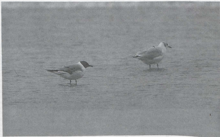
42 Kleine Kokmeeuw Larus philadelphia , IJmuiden, Noordholland, augustus 1985

GEDRAG Op zee zwemmend, rustend en af en toe pikkend in drijvend wier. Soms laag boven wateroppervlak rondvliegend. Vlucht midden houdend tussen Dwerg- en Kokmeeuw. Eenmaal op drijvende plank staand. Op strand veel rustend en poetsend. Af en toe voedsel zoekend bij waterlijn door middel van voedseltrappelen of pikken in aanspoelsel. Niet speciaal met enige meeuwesoorsoort geassocieerd.