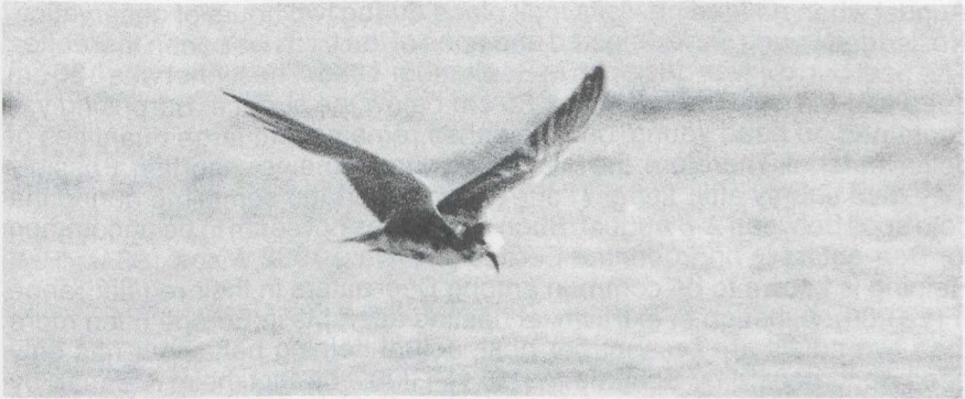
50 Black Tern Chlidonias niger , French Guiana, September 1986

Blake, E R 1977. Manual of Neotropical birds 1. Chicago.