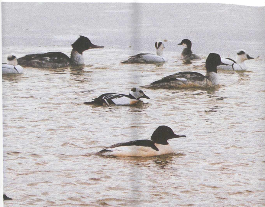
56 Stellers Eider Polysticta stelleri met Nonnetjes Mergus albellus en Grote Zaagbekken M merganser , Houtribsluizen, Flevoland, januari 1987 (C J Breek) 57 Giervalk Falco rusticolus , Eemshaven, Groningen, februari 1987 (C J Breek) 58 Slechtvalk F peregrinus , Goedereede, Zuidholland, februari 1987 (E H Ettema)