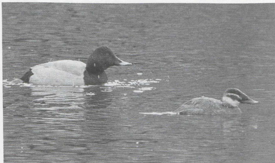
55 Witkopeend Oxyura leucocephala en Tafeleend Aythya ferina , Utrecht, Utrecht, februari 1987 (Hans Gebuis)

eerder: behalve een overwinteringsgeval in het Verdronken Land van Saeftinge Z kwamen al vanaf half januari de eerste meldingen binnen. Tot eind maart waren dit er minstens 14 in Nederland en België. De onvolwassen Zeearend Haliaeetus albicilla , die tussen Kalmthout A en het Verdronken Land van Saeftinge verbleef, werd daar nog tot 10 januari gezien. Verder was er op 4 januari een onvolwassen Zeearend bij het Ketelmeer FI, op 10 januari een adult in de achterhaven van Zeebrugge, begin januari een onvolwassen bij Gaast Fr, op 17 en 18 januari een onvolwassen bij Oud-Beets Fr en de gehele periode — in ieder geval tot 8 maart — zeker twee en wellicht drie in de Biesbosch Nb. De grootste kilometerreter van dit seizoen was wel de Giervalk Falco rusticolus die van 7 februari tot half maart regelmatig in en om de Eemshaven Gr werd gesignaleerd en daar ook in april weer enkele malen opdook. Bij Beegden L werd op 1 februari een Slechtvalk F peregrinus gezien met kenmerken van de ondersoort F p calidus . Gedurende de winter werden van veel plaatsen Slechtvalken gemeld. Bij Goedereede liet zich er een bij uitzondering eens van dichtbij fotograferen.