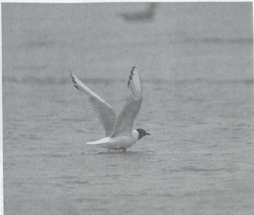
43 Kleine Kokmeeuw Larus philadelphia , IJmuiden, Noordholland, augustus 1985 (Jan Boshuizen)