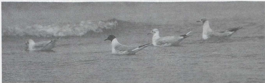
38 Bonaparte's Gull Larus philadelphia , IJmuiden, Noordholland, August 1985

ped and photographed (J A de Vries, W Bil, A de Vries; de Vries 1987).