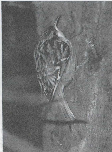
46 Tree creeper Certhia familiaris , Wieringerwerf, Noordholland, January 1987 (Arnoud B van den Berg) 47 Short-toed Tree creeper C brachydactyla , Alphen aan den Rijn, Zuidholland, February 1987 (Arie de Knijff)

23 Mystery photograph 23 obviously shows a tree creeper Certhia . The two species occurring in the western Palearctic are difficult to separate, the more so from photographs, when their characteristic calls can not be heard. The problem is made even more complicated by the geographical variation in plumage that one of them, the Tree creeper C familiaris , shows in Europe. Still, a correct identification should be possible from a good photograph like the one shown here. Useful differences between the two species can be found in the coloration of upperparts and underparts, the prominence of the supercilium and to a lesser extent in the length of hind claw and bill.