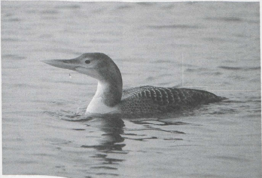
53 Geelsnavelduiker Gavia adamsii , Eke, Oostvlaanderen, maart 1987 (Peter Boesman)

januari in Het Zwin Ovl en op 10 januari op Texel Nh. Gekleurde Dwergganzen Anser erythropus met Brandgans Branta leucopsis -ouders zaten van 27 december tot in januari bij Den Bommel Zh (familie met drie jongen) en tot half januari in de Kievitslanden Fl (met vier jongen), waar in die tijd ook een ongeringde adult zat. Eind januari groeide het aantal tussen Spijkenisse Zh en Oudendoorn Zh tot maximaal vier (één met kleurringen). Tot 18 maart werden hier nog exemplaren waargenomen. Enkelingen werden gezien bij Damme Wvl op 4 en 25 januari, Uitkerke Wvl op 24 januari, Goedereede Zh op 24 januari, bij Stellendam Zh op 25 januari (met kleurringen) en bij Voorst O in februari. Tenslotte waren er twee op 9 februari bij Vorchten Gld en op 14 maart bij Noordschans Nb (één met kleurringen). Interessant was de waarneming van twee witte en één blauwe fase Sneeuwgans A caerulescens tussen Meetkerke Wvl en Zeebrugge Wvl van 7 tot 17 januari. Canadese Ganzen B canadensis werden weer vanaf januari gemeld. In februari werden tijdens een telling langs de IJssel c 350 exemplaren vastgesteld. Vanaf